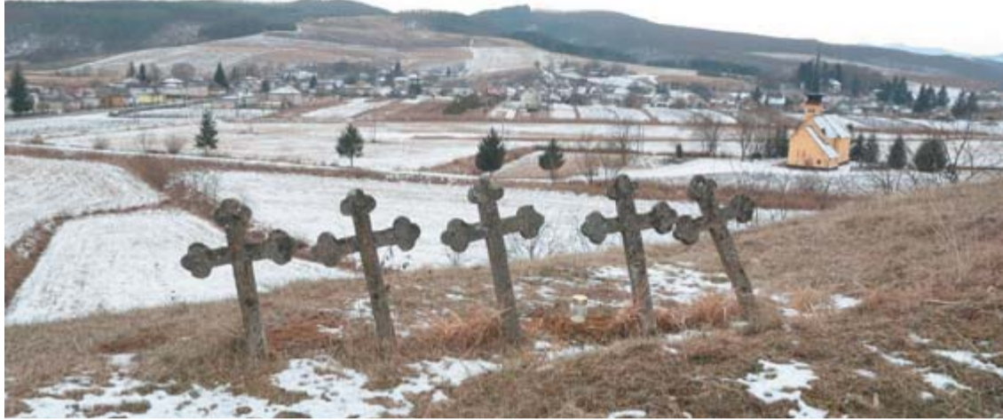
A két településrész között van a szépen felújított templom – a legöregebb falait az 1200-as években húzták fel – és a temető

Saját erdeje nincs az önkormányzatnak, de patak kettő is átfolyik a településen. A közmunkaprogram részeként a Tarna-patak és a Kőverő-patak med-