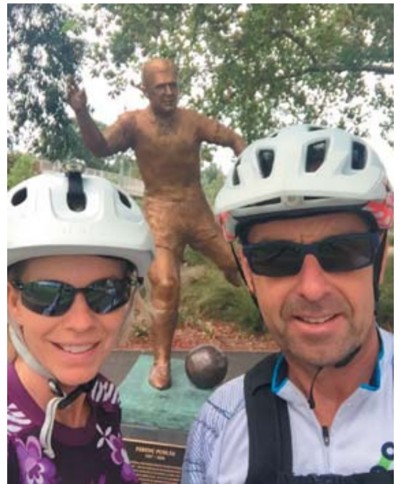
A szoboravatás másnapján, vasárnap délelőtt, a Yarra kanyarulatait követő bicikli és sétáló út szomszédságában lévő Puskás szobor már köszönthette első látogatóját. Köszönjük a beküldött fényképet.

Szepesi György első magyar sportújságíróként kapta meg a Gerevich-díjat, birtokosa az Orth György-díjnak, az Aranytollnak. Kodály Zoltán közművelődési díjat vehetett át a Pro Renovanda Cultura Hungariae Alapítvány kuratóriumától. 2004-ben a Prima Primissima-díj kitüntetését kapta, és ugyanebben az évben a Magyar Sportújságírók Szövetsége Életműdíjjal jutalmazta. Birtokosa a NOB Olimpiai Érdemrend ezüst fokozatának, valamint a Magyar Köztársasági Érdemrend Középkeresztjének is. 1995-ben szűkebb pátriája, Budapest XIII. kerülete, majd 2005-ben a főváros is díszpolgárává avatta. 2012-ben az újonnan alapított Magyar Sportsajtó Halhatatlanja díjat és a Magyar Olimpiai Bizottság sajtóbizottságának Média-különdíját vehette át. 2016-ban a Magyar Labdarúgó Szövetség (MLSZ) Életműdíját kapta meg. A róla elnevezett Szepesi-díjat, amellyel a hazai újságírás és sportújságírás egyik meghatározó alakját díjazták, először 2015-ben adták át.