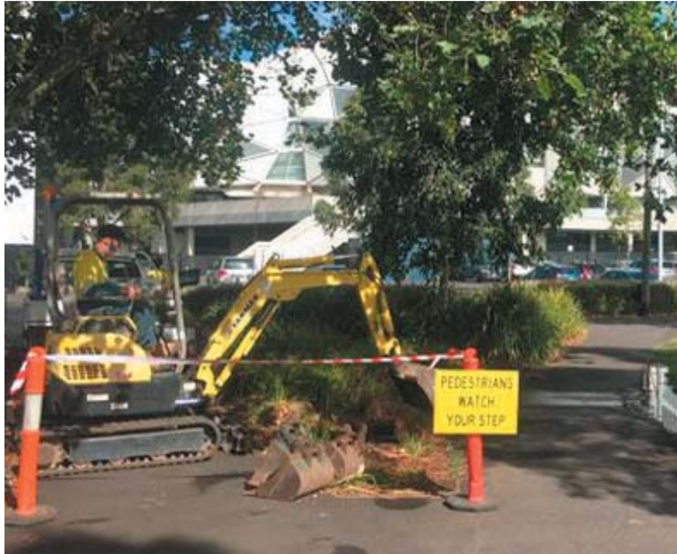
A szobor egy fantasztikus presztízsű helyen, az Olimpiai Parkban fog állni

búcsúztató) Budafok fő támogatója, aki az elmúlt években kétszer is elhozta az ausztrál U17-eseket a Puskás-Suzuki-kupára. Melbourne-ből, ahol Puskás Ferenc az akkor még létező helyi görög csapattal megnyerte a kontinensnyi ország bajnokságát (NSL) és az Ausztrál Kupát is, amikor 1989 és 1991 között a városban dolgozott végleges hazatelepülése előtt.