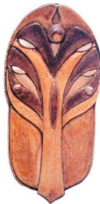
Magyar Életfa Díj

★ Mi is szívből gratulálunk Ausztráliából a hosszú évek munkájával kiérdemelt rangos elismeréshez!