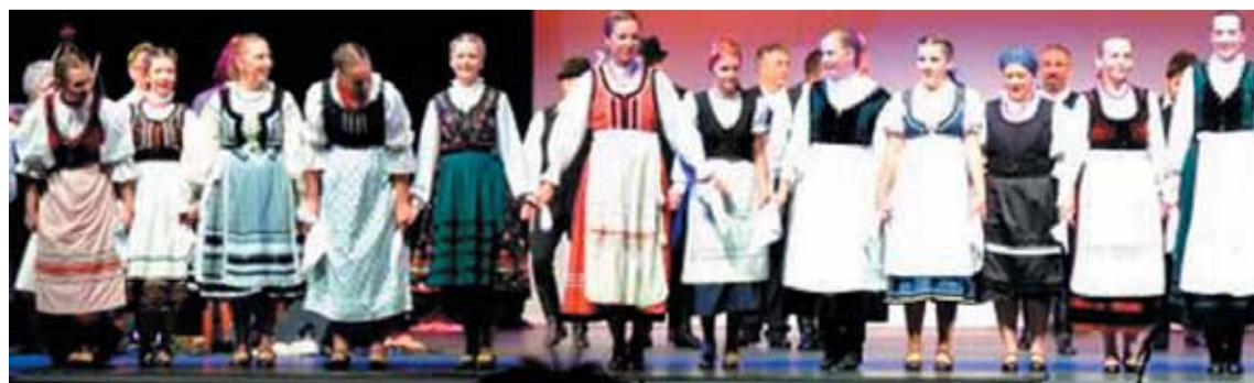
A Gálakoncert táncosai