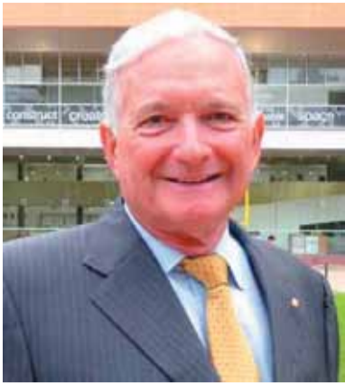
Hon. Nick Greiner