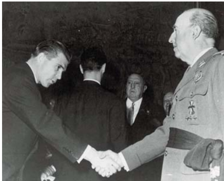
Puskás Franco tábornokkal egy évvel későbbi fotón