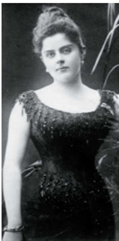
Mary von Vetsera bárónő fotója 1888-ból

1889 január 29-én, nem sokkal éjfél előtt a mayerlingi vadászkastély eme-