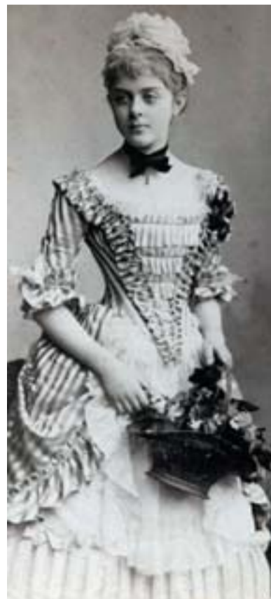
Vetsera Mária bárónő korabeli fotón

A gyászos hírt Hoyos gróf vitte Bécsbe. A Burgban a gróf először Erzsébet császárnénak jelentette be, hogy meghalt a trónörökös. Erzsébet a pár perces sokk után összeszedte magát, és átment Ferenc József lakosztályába. Mintegy félórát beszélt egymással a császári pár, de hogy miről volt szó köztük, mai napig nem lehet tudni. Már a kortársaknak is feltűnt, hogy Ferenc József milyen „higgadt rezignáltsággal” fogadta fia halálhírét. Először az terjedt el az udvarban, hogy az úgymond „alsóbb körökből” származó