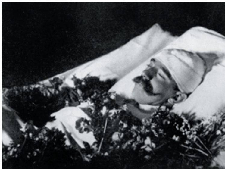
Rudolf herceg halálos ágyán

A fiatalemberré váló Rudolf azután közelebb került édesanyjához. Rudolf klasszikus liberalizmusa anyja nézeteihez állt közel, mindketten szenvedtek a konzervatív Habsburg-udvar spanyolosan szoros etikettjétől, mozdulatlanságától, kapcsolatuk megjavult. Viszonya császári apjával viszont igen gyorsan megromlott. Rudolf sohasem titkolta kritikus véleményét Ófelsége osztrák vagy magyar kormányával szemben. Ez kiváltotta a Monarchia kormányköreinek bizalmatlanságát a trónörökösrel szemben, akit emiatt teljesen elszigeteltek a politikacsinaló folyamatoktól. Gyanús kapcsolata miatt a császári titkosrendőrség is szinte állandó megfigyelés alatt tartotta Rudolft. A konzervatív császár és liberális fia között áthidalhatatlan szemléletbeli különbség feszült. Ferenc József semmilyen jelét nem adta, hogy fiát be akarná vonni a kormányzásba. Egyrészt úgy érezte, még évtizedekig uralkodhat, másrészt úgy gondolta, Rudolfnak ki kell nőnie a liberalizmust, mint valami ifjúkori bolondságot, addig nem alkalmas az uralkodásra. Ferenc József tehát féltékenyen őrizte uralkodói hatalmát, és azt nem osztotta meg a trón örökösével sem. Az is tény, hogy ezt nemcsak a liberális Rudolffal szemben tette, hanem később, Rudolf halála után, az új trónörökösrel, a konzervatív és imperialista gondolkodású Ferenc Ferdinánd főherceggel szemben is szilárdan megőrizte hatalma oszthatatlanságát.