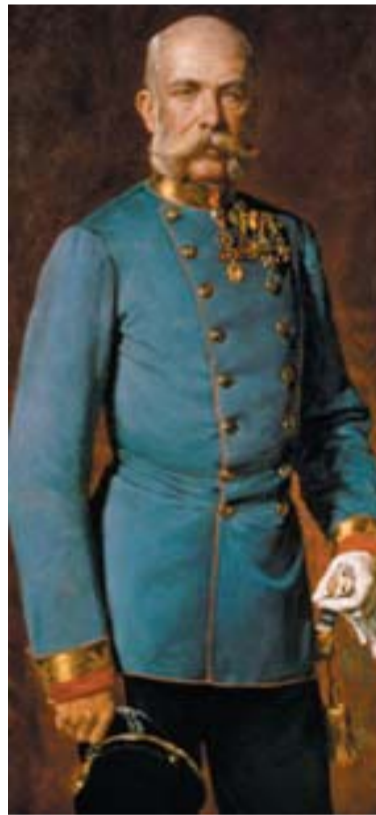
Ferenc József császárnak végig feszült volt a Rudolffal való kapcsolata

Az újratemetés előtt az azonosság megállapítása céljából a bécsi Igazságügyi Orvostani Intézet szakértői vizsgálták meg a csontvázat. Annak a szakértői kimondása mellett, hogy a csontok kétséget kizáróan néhai Vetsera Mária földi maradványai, tettek