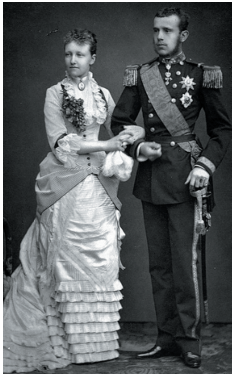
Stefánia Rudolf trónörökös oldalán

Vetsera Mária megmérgezte a trónörökösöt, de ebbe nem illett bele a Rudolf halántékán éktelenkedő hatalmas seb.