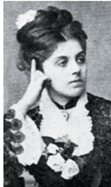
Helena von Vetsera báróné, Mary édesanyja volt Rudolf első szeretője

Az indulatos császár még azt is fia fejéhez vágta, hogy a liberalizmussal