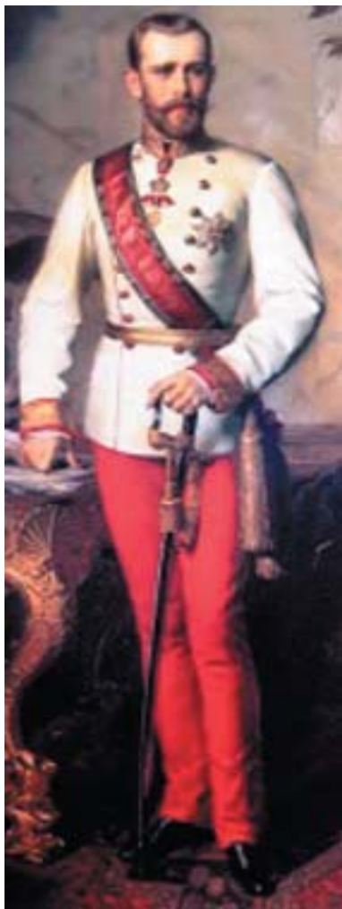
Rudolf főherceg, trónörökös

Közel 128 éve nem tudni, hogy valójában mi is történt azon a fagyos januári hajnalon a Bécsi-erdő ölén megbúvó vadászkastélyban. Szerelmi öngyilkosság, részeg verekedés, vagy sötét háttérű politikai merénylet végzett-e az Osztrák-Magyar Monarchia trónjának várományosával, a bécsi udvar mohos konzervatívizmussal szembeálló, bohém természetű, de ragyogó intellektusú Rudolf főherceggel? Számátlan teória született e tisztázatlan háttérű öngyilkosság vagy merénylet mélyebb okainak felfedésére. Összeállításunkban a rejtélyes haláleset megválaszolatlan kérdéseit szedtük csokorba.