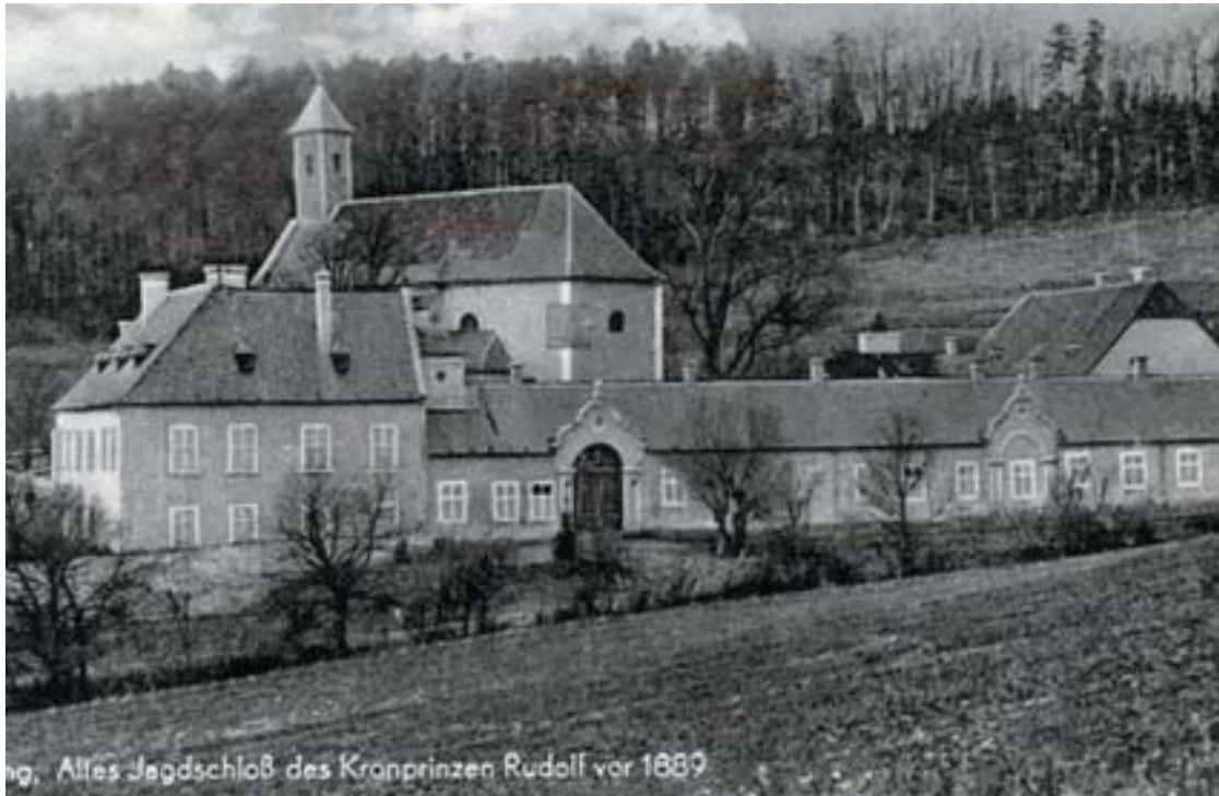
A mayerlingi vadászkastély 1889-ben. Később Ferenc József lebontatta az épületet

modern államjogi reformokkal, a külpolitikában pedig a francia-orosz szövetséggel, és a Monarchiára veszélyt jelentő német függőség feloldásával lehet biztosítani.