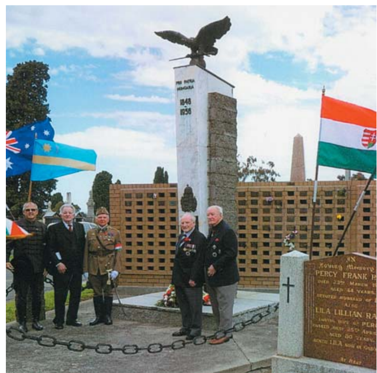
Az 56-os Emlékmű zászlódiszben