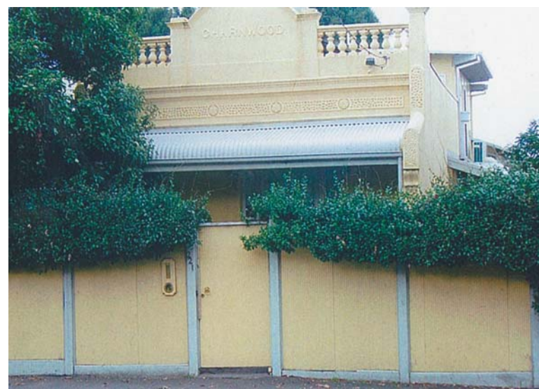
Farkas Márton háza Richmondban (VIC)

Kossuth Lajosnak hűséges katonája volt. Az 1848-49-es magyar szabadságharc bukása után, sok magyar honvédtiszt kényszerült elhagyni szeretett hazáját. A Habsburg császári önkény