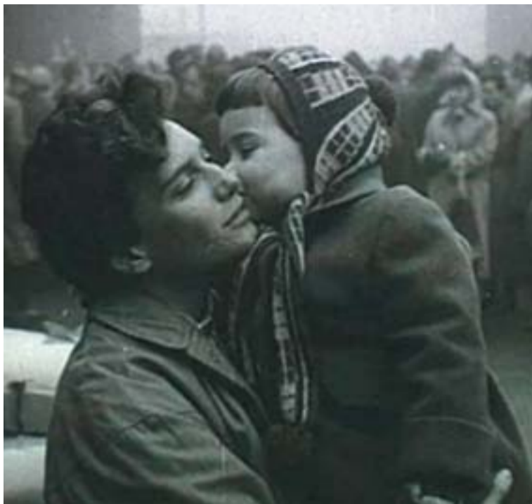
Az olimpiai bajnok Székely Éva és kislánya, Gyarmati Andrea 1956-ban Budapesten