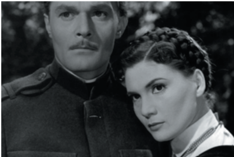
Darvas Iván és Bara Margit a Bakaruhában című, 1957-es filmben, amelyet Fehér Imre rendezett és Badal János fényképezett

sott a színpadról ” — mondta korábban Bara Margitról Törőcsik Mari.