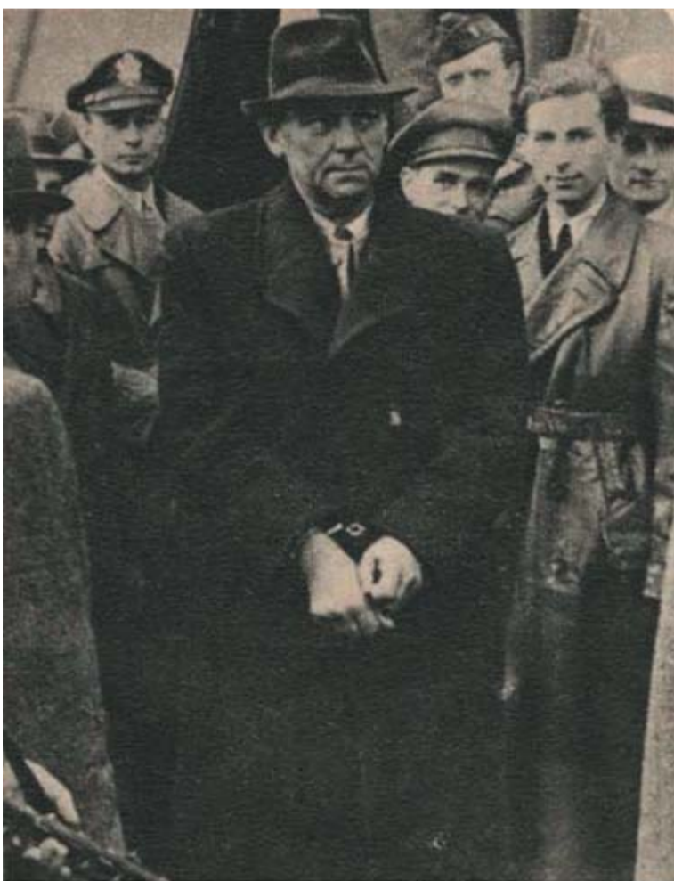
Kiss Ferenc utban a Markó utcai fogházba