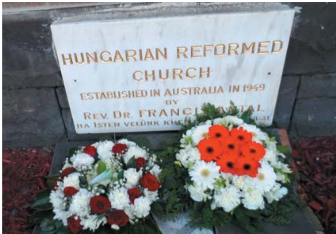
Az alapító lelkész Emléktáblája