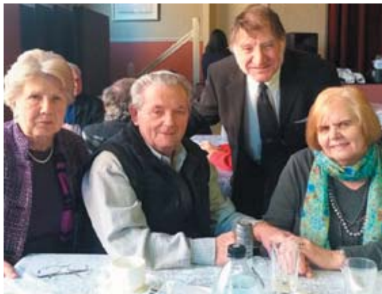
A Bona házaspár asztaltársasága