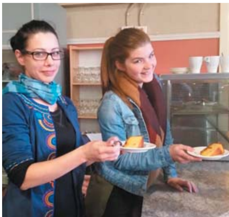
A bár kiszolgáló önkéntes hölgyek a croydoni pékség finom süteményével

Egy világhálós kislexikon, amely az MSZP jelvényéből fabrikált magának címet, ezt írja a Magyar Forradalmi Munkás-Paraszt Kormányról: „A Magyar Népköztársaság kormányának neve 1956. nov. 4-től.