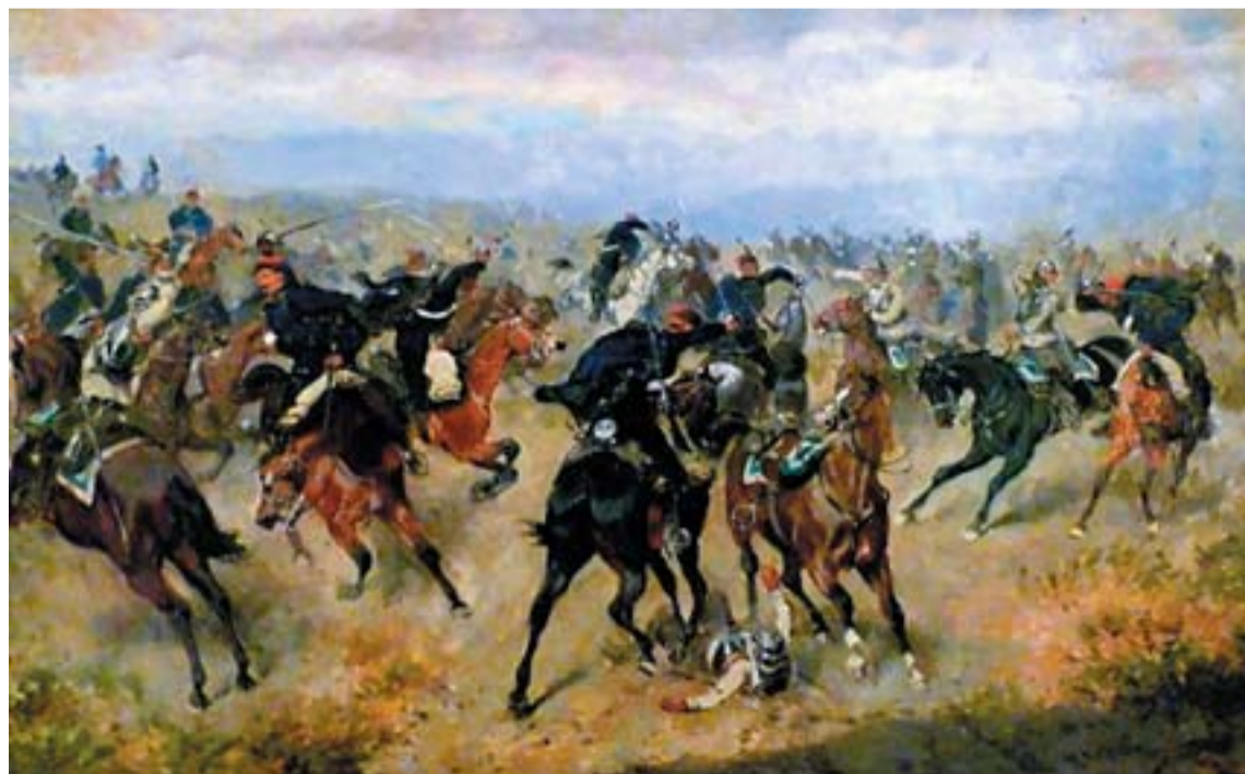
Császári huszárok és porosz vértések közelharca a königgrätzi csatában Alexander Ritter von Bensa festménye (1866)