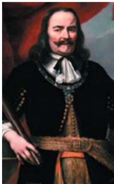
Michiel de Ruyter admirális. Ferdinand Bol festménye

Payr Sándor írta A magyar protestáns gályarabok című tanulmányában (Budapest, 1927): „A vádlottak Szelepcsényi előtt mindig azt sürgették, hogy ne általánosságban ítéljenek el 700 lelkész, hanem állapítsák meg név szerint, ki, mikor, hol és miben vétkezett? De erre nem került a sor, egyenként ki sem hallgatták őket, hanem kimondották a halálos ítéletet jelenlevőkre és távolmaradottakra egyaránt.” A halálbüntetéstől a vádlottak csak úgy menekülhettek meg, ha áttértek a katolikus vallásra vagy írásban lemondtak egyházi szolgálataikról. Sokan ezt az utat választották, csakhogy mentsék az életüket, de 67 prédikátor kitarzott hite mellett és