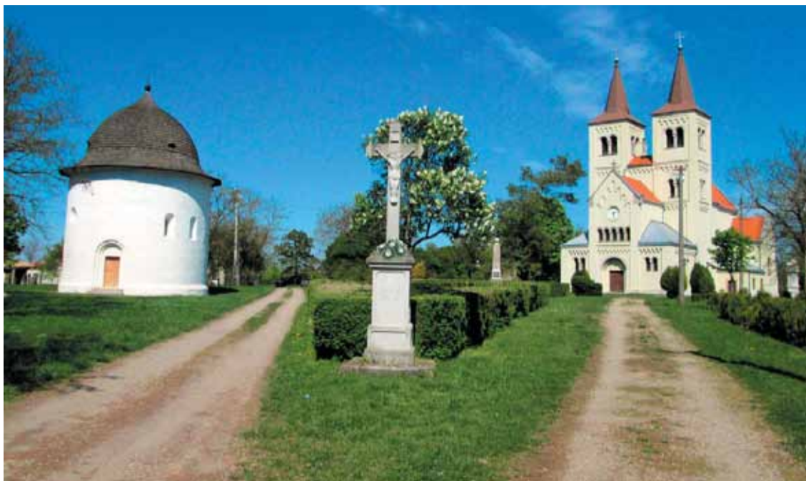
A Körtemplom és a Szűz Mária tiszteletére szentelt apátsági templom

tuk, évi háromszor szentmisét is tartanak itt, magyar nyelven (pünkösdhétfőn, Szűz Mária mennybevétele napján, Szűz Mária születésének ünnepén). Ha szemben állunk vele, akkor a bájos kivitelű kápolna jobbja egy már régóta nem működő kutat talá- lunk, amit az itt élők Szentkútként emlegetnek. A legenda szerint Szent László király úgy és azzal mentette meg katonáit a szomjazástól, hogy kardját a földre szúrta és erre tiszta víz fakadt. A kápolna másik oldalán pedig egy valóban ősinek mondható magyar emlék, egy földvár eredetileg háromsoros védelemként szolgáló sáncainak kevéske, de azért így is méretes maradványai. Keletkezéséről az idők során több teória megfogalmazódott, melyek közül a régészek a legvalószínűbbnek azt tartják, hogy valamikor a 10. században épült, Géza fejedelem emeltethette. Ahogyan a verőfényes napsütésben ott sétálgatunk a maradványok tövében, előbb még csak szájatva szemléltünk mindent, de aztán, 21. századi fejjel gon-