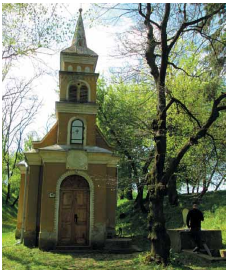
A kegykápola és a Szentkút