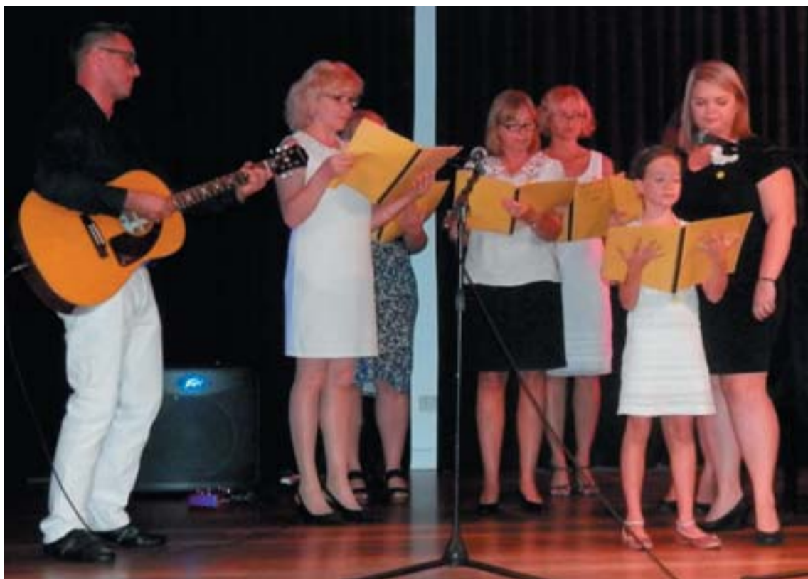
Rádióműsor, ahogyan még sohasem hallottad. Jótékonysági, zenés irodalmi est a 4EB Magyar Rádió, a Magyar Rádió Mozaik Sydney és a Panoráma Világklub szervezésében a Pécs melletti Szemem fénye a Beteg gyermekekért alapítvány javára. Április 16-án este 6 óráig, Gold Coaston Ausztráliában.

Áder János köztársasági elnök idén február 12-én adományozta a Magyar Érdemrend nagykeresztje (polgári tagozat) kitüntetését Steven F. Udvar-Hazynak, az indoklás szerint ezzel ismerve el a repülőgépiparban elért eredményeit hasznosító és a repülés, illetve az úrhajózás széleskörű megismertetését szolgáló sokrétű és nagyvonalú támogató tevékenységét, továbbá Magyarország jó hírét növelő, példaértékű életútját.