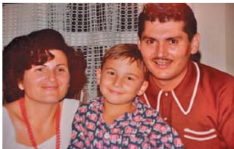
id. Kaponay család – 1978

Az érdeklődők a könyvet megrendelhetik a következő Email címen: reka@dawnoftheguardian.com