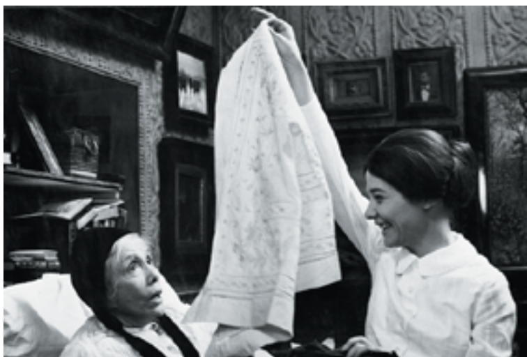
Darvas Lili és Törőcsik Mari a Szerelmek című filmben

Május 11-én Ferenc névnapja van. Kibővített naptárak szerint Fábó, Fábúsz, Fabrició, Fabricius, Fabriciusz, Filip, Fülöp, Gujdó, Izidor, Izidóra, Izor, Jakab, Jákó, Jákob, Jakus, Kalliszta, Majlát, Mályva, Mirandella, Mirandola névnapja van.