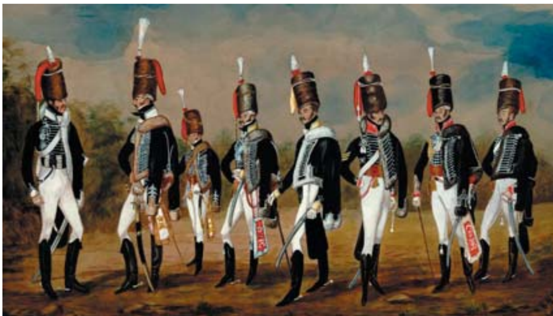
Huszárok a 18. század végén

A bukovinai székely települések közül Andrásfalva és Hadikfalva is a hős magyar tábornok emléket őrzi. Az egyik leghíresebb magyar huszár bronz lovas szobra a budai várban látható. Hadik András gróf, birodalmi tábornagy, a 18. század nemzetközi híru hadvezére 80 éves korában, 1790. március 12-én hunyt el.