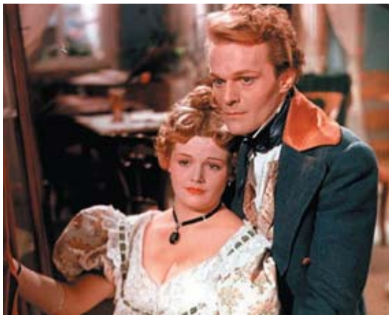
Krencsey Marianne és Darvas Iván a Liliomfi című filmben