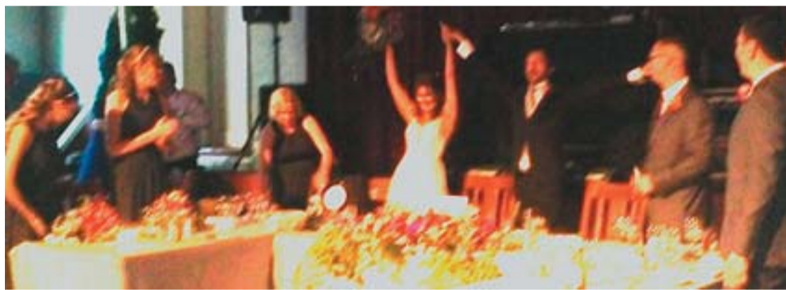
Lakodalmom a Bocskaiiban