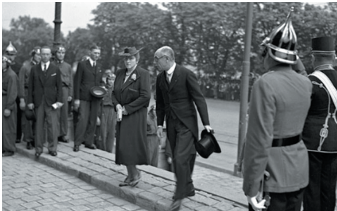
Teleki Pál miniszterelnök és felesége Horthy István esküvőjére érkezik a budai Szilágyi Dezső téri templomb

Tömören azt is mondhatnánk, a nyers reálpolitika és az ideálok feloldhatatlan összeütközése. Miközben tudomásul vette, hogy Magyarország messzemenő alkalmazkodásra kényszerül a tengelyhatalmakkal szemben, nem feledkezett el a hosszabb távon meghatározó geopolitikai tényezőkről és arról, hogy a morális hitelt nem lehetséges teljesen feláldozni a reálpolitikai érdekelv oltárán.