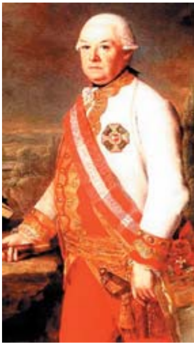
Gróf Hadik András tábornagy korabeli portréja

A hadtörténelem leghíresebb huszár-csínyje Hadik András gróf nevéhez fűződik. A vakmerő portyáiról elhíresült magyar stratégának, a Habsburg Birodalom legmegbecsültebb tábornokának Berlin megsarcolása volt a legismertebb haditette. Az egyik leghíresebb magyar hadvezér, Hadik András gróf 226 éve, 1790. március 12-én hunyt el.