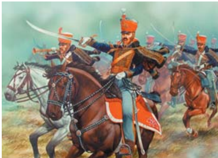
Hadik András alig több mint 4000 lovassal indult el a kalandos portyára