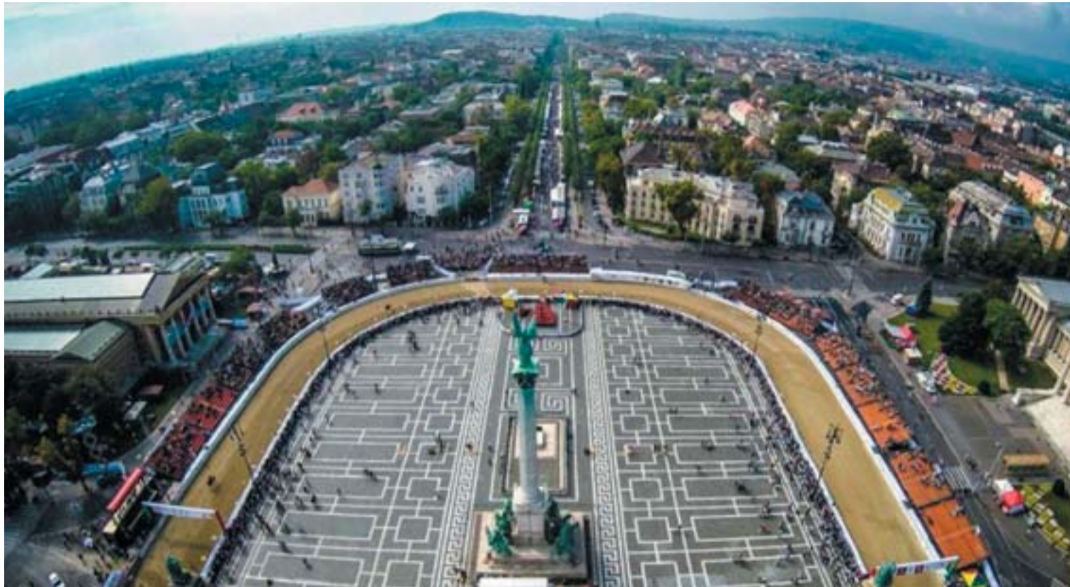
A drónnal készült felvétel a Nemzeti Vágta helyszínéről, a budapesti Hősök teréről

Az amerikai Condé Nast Traveler utazási magazin olvasói szerint Budapest a világ második legjobb városa. Több mint 128 ezren adták le szavazatukat a 28. alkalommal meghirdetett voksoláson. Az első helyen Firenze végzett, alig 500 szavazattal megelőzve Budapestet. A harmadik Bécs lett, mindössze 70 voks kellett volna, hogy a magyar főváros elé kerüljön.