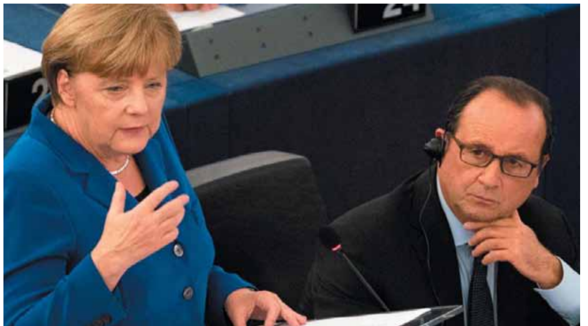
Cervantes 400 éves regényalakja, a bús lovag megrohamozta a szélmalomokat – hanyattesett butaságában

Hollande és Merkel politikája egy kialakult helyzetre irányul, céljuk e helyzet „kezelése”. A velejáró kapkodás, összevissza beszéd, érzélgősség látványosan bizonyítja, hogy a politika célt téveszt, amikor a helyzetet akarja uralni. A helyzet nem a lényeg, hanem a következmény, a térben való elhelyezkedés, az életproblémák és a