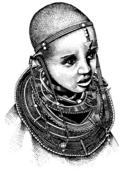
Maszáj lány ékszerekkel. Márffy János sorozatából.