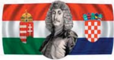
MAGYAR-HORVÁT BARÁTI KÖR