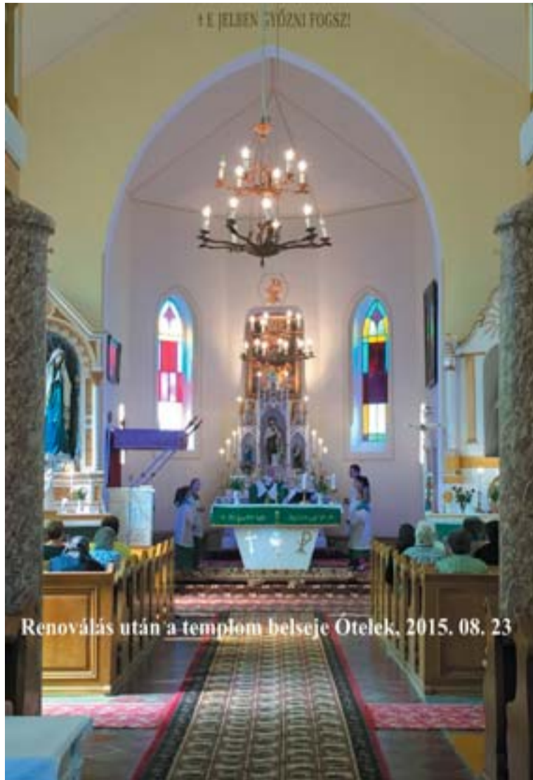
Renoválás után a templom belseje Ótelek, 2015. 08. 23

Köszönjük a lelkesedést, szolidaritást és áldozat-készséget, külön szeretnénk megköszönni azoknak is, akik más álamokból küldenek rendszeresen tá-