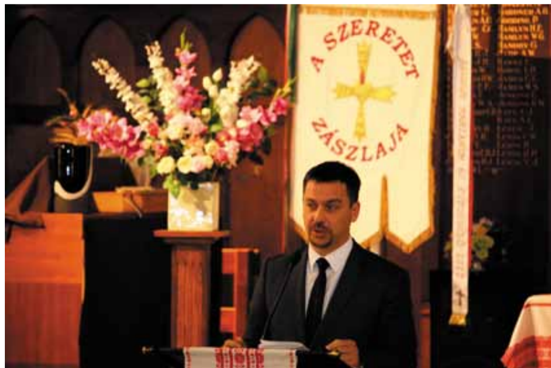
Bakonyi Péter vezető konzul, Magyarország Konzulátusa, Melbourne

Szaladnak a hetek és nemsokára elérünk az év végéhez. Örömmel jelentjük, hogy ez év szilveszter estéjén egy vacsorával egybekötött zenés táncos est lesz a Bocskai nagyteremben.