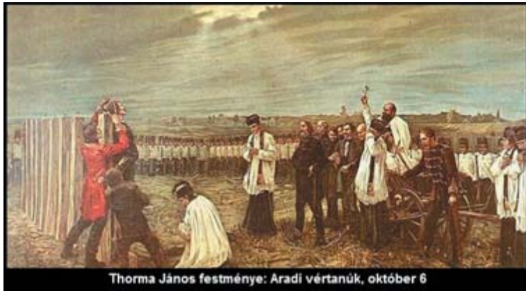
Thorma János festménye: Aradi vértanúk, október 6

régen kiérdemelte már a jogot arra, hogy végre önmagát kormányozza. Harcukat törvényesnek tartották, hiszen 1848 tavaszán az osztrák császári udvar is elismerte a magyarországi reformok szükségességét. Az Udvar meghátrálása azonban csak 1848 nyaráig tartott. Miután az európai uralkodók sorra, mindenütt levették a forradalmakat, Bécs a magyarok ellen fordult. A szabadságharc kitört és sok ezer bátor magyar katona és tiszt véráldozatát követte.