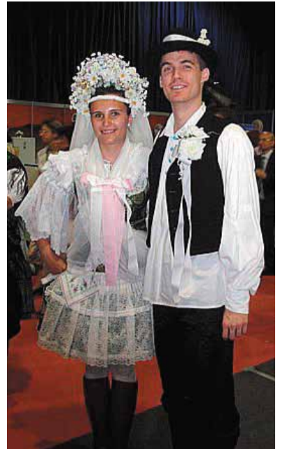
Palóc menyasszony vőlegény