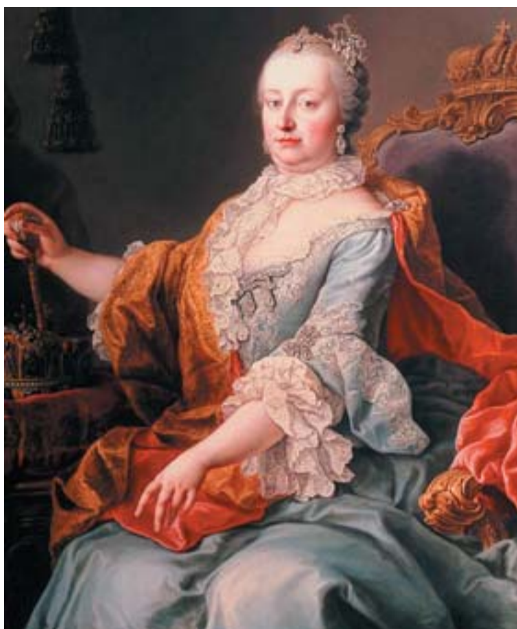
III. Károly lánya, Mária Terézia jövőre kerül sorra a pozsonyi koronázási ünnepségekben

Az idén a szervezők III. Károly magyar király, más nevén VI. Károly német-római császár 1712-es pozsonyi