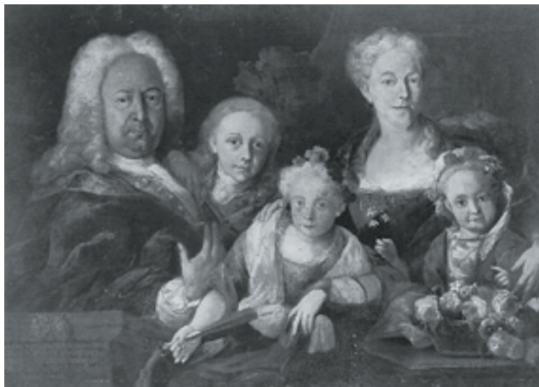
III. Károly és felesége, Erzsébet Krisztina braunschweig-wolfenbütteli hercegnő három lányukkal: Mária Teréziával, Mária Annával és Mária Amáliával

A hétvégén tartották Pozsonyban a 13. Koronázási ünnepségek nevet viselő rendezvénysorozatát, amellyel a magyar királyok, királynők és királynék egykoron itt zajlott koronázásaira emlékeznek a pozsonyiak. Az idén III. Károly magyar királyt, Mária Terézia apját „koronázzák újra.”