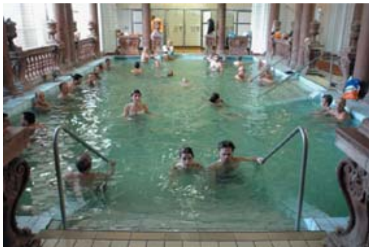
A Széchenyi fürdőben is termásvízben ázhatunk

Végül ismét csak a nevekről: Magyarországon csak olyan nevet adhatnak a szülők a gyermeküknek, amelyet egy listáról, az utónévkönyvből választanak. Ez ugyan folyamatosan bővül, mégis, ha olyan névbe szeret bele a szülő, amely nincs ezek között, külön engedélyt kell kérnie, amelyet a hatóságok vagy megadnak, vagy nem.