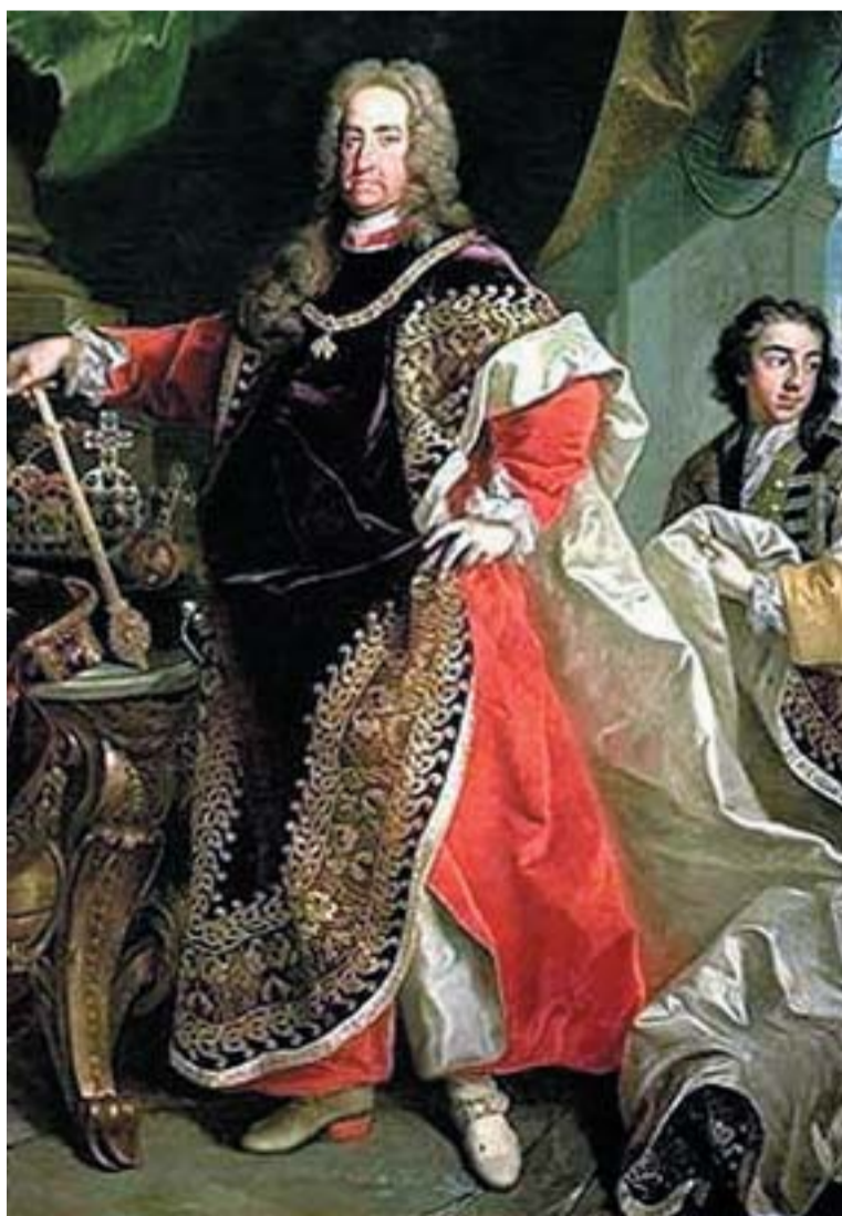
III. Károly magyarországi uralkodását a Rákóczi-szabadságharcot lezáró szatmári béke aláírásával kezdte, s 1740-ben bekövetkezett halála is Magyarországon történt, a Moson vármegyei Féltorony mellett tartott vadászatán, ahol megbetegedett és váratlanul elhunyt

A koronázási ceremónia után az újdonsült „király” lovaggá üti aranysarkantyús vitézeit, majd kíséretével — több megállót tartva — átvonul a Hviezdoslav térre, ahol leteszi az ünnepélyes esküjét.