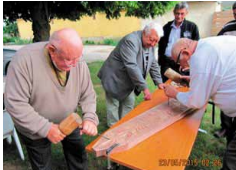
Munkában a fafaragók a Böszörményi László Faluháznál

A magyar vidék megmaradásának és fejlődésének lehetőségeire, esélyeire kívánta felhívni a figyelmet ez