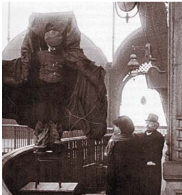
Franz Reichelt a párizsi Eiffel-torony párkányán a végzetes ugráshoz készülődik 1912. február 4-én

A probléma sikeres megoldására tűzték ki 1910-ben a 10 ezer frankos La-