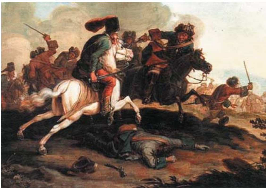
Georg Philipp Rugendas festménye a kuruc-labanc lovaspárbajról

A Rákóczi szabadságharcig szinte egyáltalán nem szerepelt a közéletben, és nem is tartott igényt rá — amikor azonban a felkelés kitört, hazafiként kötelességének érezte, hogy tegyen valamit az országért. A magyar ügyek védőjeként vonult be a köztudatba, I. Lipótnak ki is fejtette, hogy véleménye