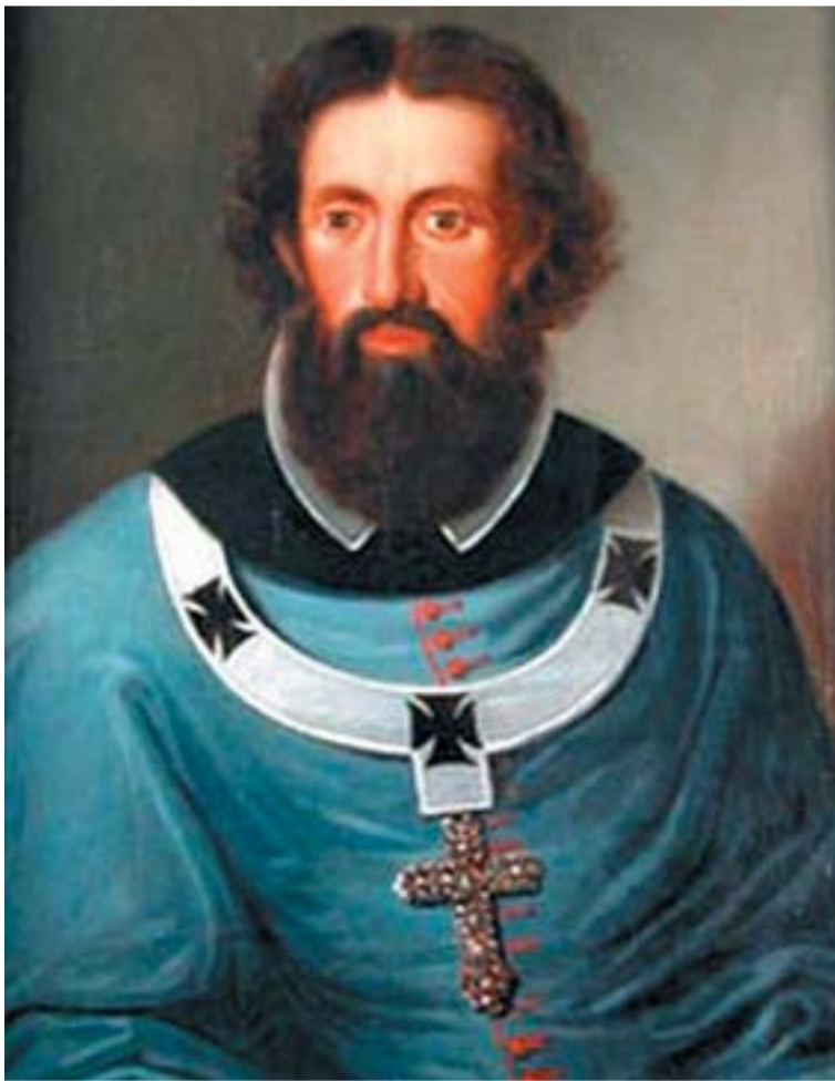
Széchényi Pál érsek portréja