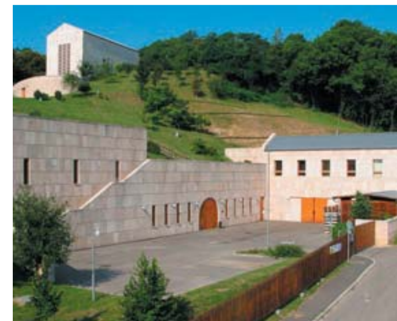
Pannonhalmi Apátsági Pincészet