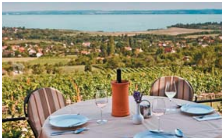
Látkép a csopaki dombról

Még ennél is izgalmasabb a terasz az egri borokkal és kávéval, panorámával a Nagy-Eged-hegyre, az Almagyar-, a Síkhegy- és a Pajdos-dűlőkre, a Bükk és a Mátra vonulataira. A faházak mellett és a medence partján napokat el lehet tölteni a szőlőtőkék között. Ha valaki aktív kikapcsolódásra vágyik,