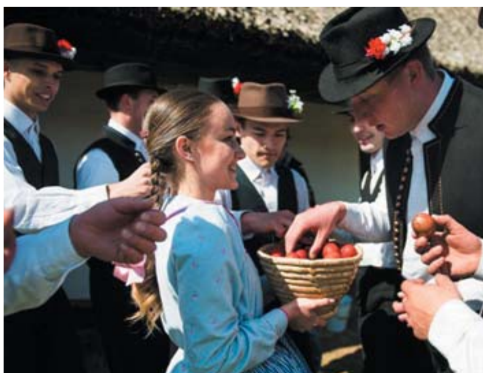
A Sóstói Múzeumfaluban volt a mulatság, és aki locsolt, megkapta a piros tojást.