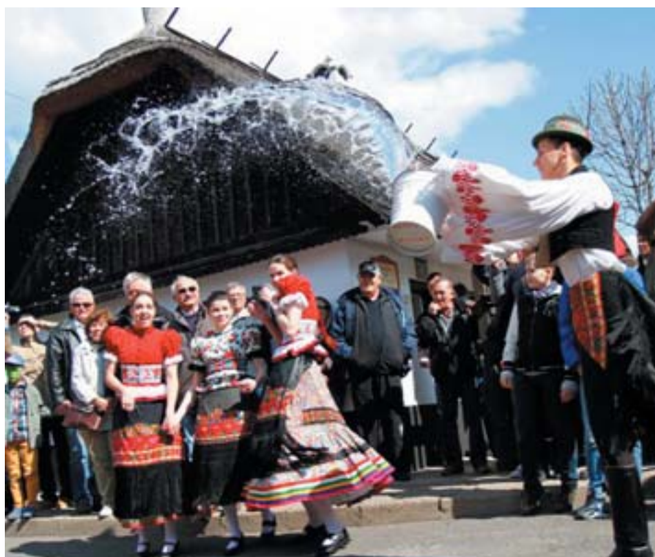
Mezőkövesden a matyó fiúk locsoltak