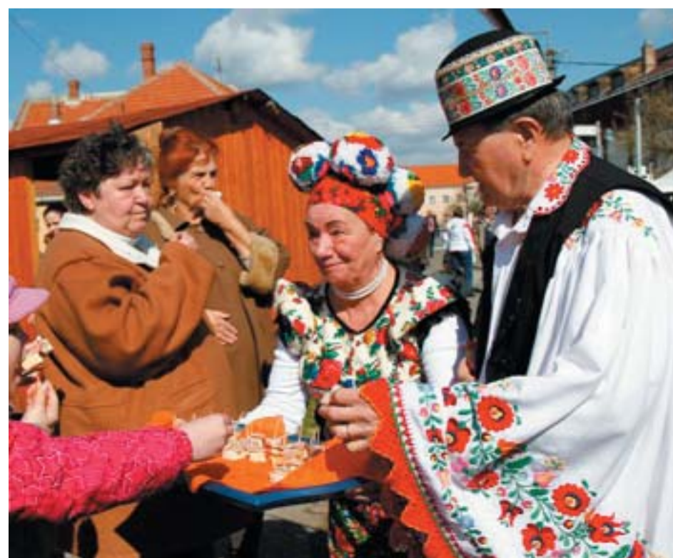
Az étel is előkerült