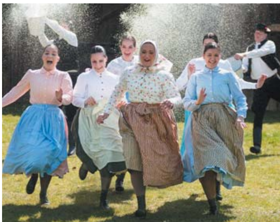
Nyíregyházán sem úszták meg a lányok