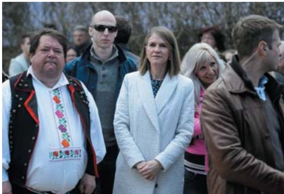
Colleen Bell, az Egyesült Államok budapesti nagykövete és Szabó Csaba polgármester

Hollókő, Mezőkövesd, Nyíregyháza és Lendvajakabfa. Négy település a sokból, ahol a hagyományokat megtartva nem apró kis üvegekből, hanem vödörből locsolták meg a lányokat. A kakukktojás Lendvajakabfa, ahol drónnal vették üldözőbe a lányokat. Hollókőre, az ország egyik legnagyobb húsvéti fesztiváljára az Egyesült Államok budapesti nagykövete is ellátogatott. (MTI képriport)