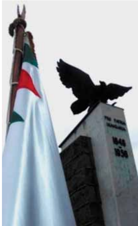
Carltoni Temető Magyar Hősök Emlékműve