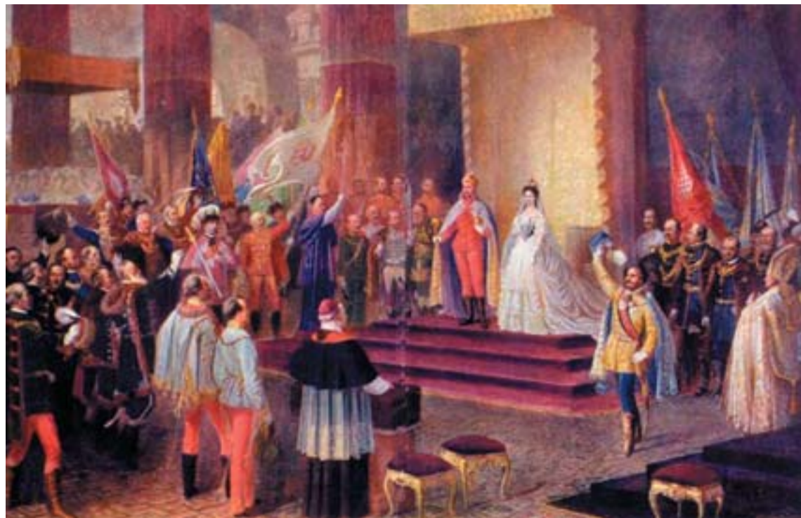
Ferenc József magyar királlyá koronázása Budán. Az 1867-es kiegyezés alkotta a dualista rendszer államjogi alapjait

II. Ferencként kívánt uralkodni, és előre elkészítette azt az átfogó államjogi reformtervet, amely a Monarchiát dualista monarchikus államszövetség-