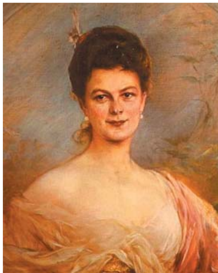
Chotek Zsófia grófnő portréja. Ferenc József sohasem bocsátotta meg unokaöccsének a grófnővel megkötött morganatikus házasságát

Bécsben és Budapesten sem kedvelték Ferenc Ferdinánd (1863 – 1914) I. Ferenc József császár öccse, Károly