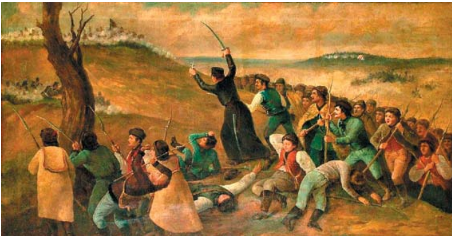
Stech Alajos: Erdősi Imre a branyisztkói ütközetben (1880 körül)

A Piarista Rend Magyar Tartományának provinciális, Labancz Zsolt hangsúlyozta: az iskolának ma is arra van szüksége, hogy meg tudja álmódni azt, hogy az előírtakon túl mire van szüksége a gyerekeknek. A látogatóknak azt kívánta, hogy a kiállítást megtekintve kerüljenek kapcsolatba azzal a lelkiülettel, amely a piaristákat jellemezte a tanítás során.