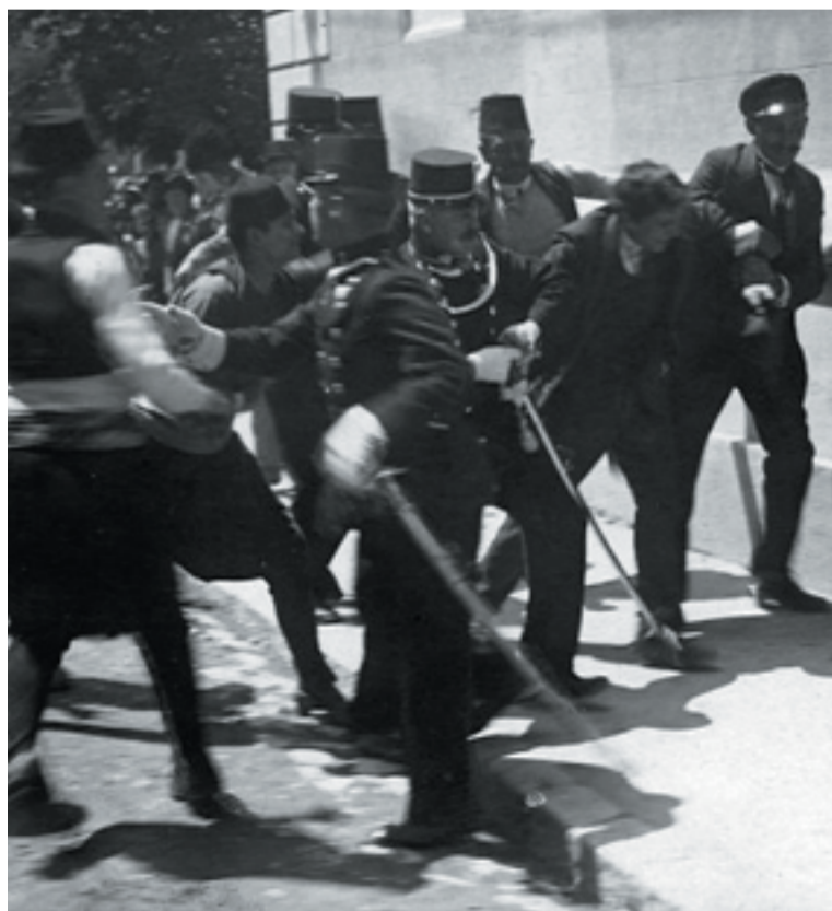
Gavrilo Principet elfogják a végzetes szarajevói lövések után. A merénylettel minden megváltozott

Ferenc Ferdinánd rendkívül akkurátusan készült leendő hivatala elfoglalására. Meggyőződése szerint a Monarchia mint államalakulat politikai túléléséhez a dualista államszerkezetet felváltó, és a Duna-menti birodalom etnikai összetételének megfelelő új, föderalista berendezkedés kialakításán át vezet az út. Trónra lépése után