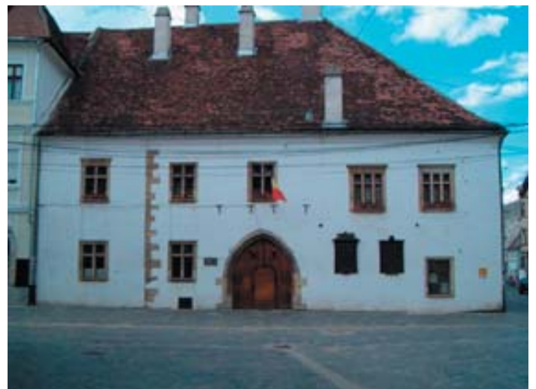
Mátyás király szülőháza Kolozsváron

V. László 1457 november 23-án váratlanul elhunyt. Rebesgetik, hogy megmérgezték, de erre nincs történelmi bizonyosság. Mindenestre a király hirtelen halálával megüresedett a magyar trón. A bárók olyan, lehetőség szerint kevésbé erélyes uralkodót kívántak trónra ültetni, akinek „markuk-