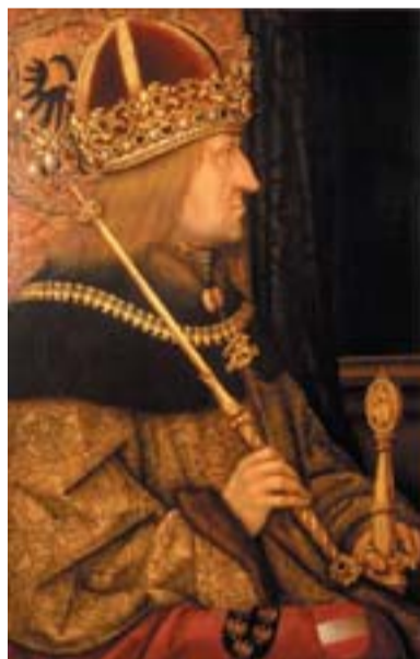
V. László király egykorú portréja

Az ország egyik legbefolyásosabb nagybirtokos családjának életében a családfő, a nándorfehérvári győztes, Hunyadi János 1456 augusztus 11-én bekövetkezett halála komoly változást hozott. Hunyadi János halála után a Habsburg család sarja, V. László király közeli hívét és rokonát, Cillei Ulrikot nevezte ki országos főkapitánynak. Cillei azonban elődjével szemben a hatalmát nem a fenyegető török veszély megfékezésére, hanem a Hunyadi család — az ország leggazdagabb birtokos famíliája — megsarcolására igyekezett felhasználni.