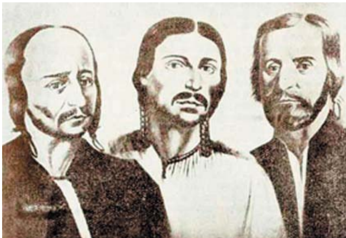
Closca, Horea és Crisan, a román lázadás három vezére