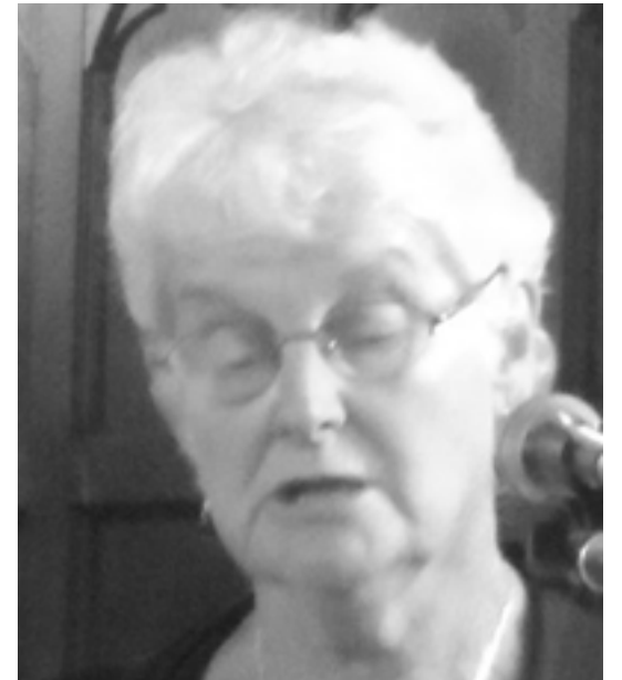
Don testvére búcsúzik

His kindness, courage and determination will be treasured forever..