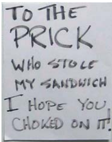
Üzenet a hűtőn vagy köremailben

A vállalati hűtőszekrénybűnözés nemzetközi jelenség (vonatkozó szakirányú tananyag: az összes jobb sitcom egy epizódja, amelyiket a hűtőből kievett étel köré építették föl), megnyugtató, minden esetben alkalmazható megoldás eddig még nem született a problémára, de kísérletek akadnak. Ezek különböző hatásokkal működnek, és nem ugyanakkora az ener-