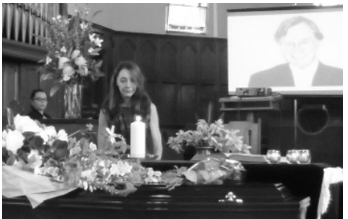
Victoria a gyászoló özvegy, meggyújt egy gyertyát a férje emlékére