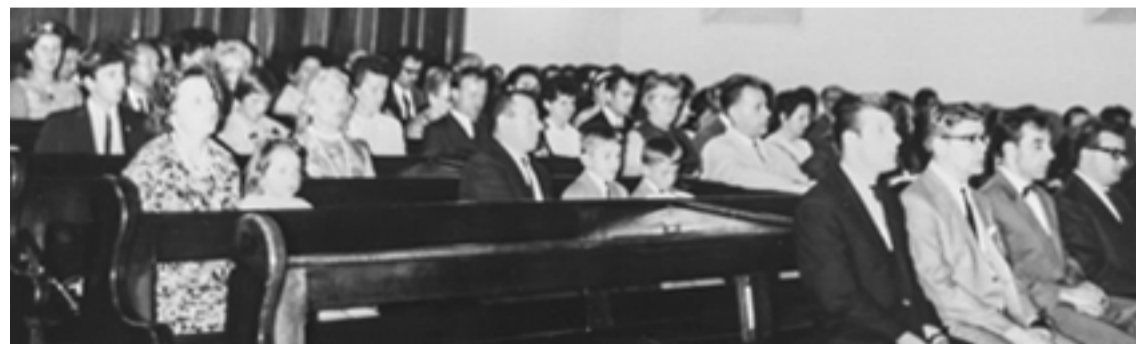
Napier Street-i gyülekezet 1966