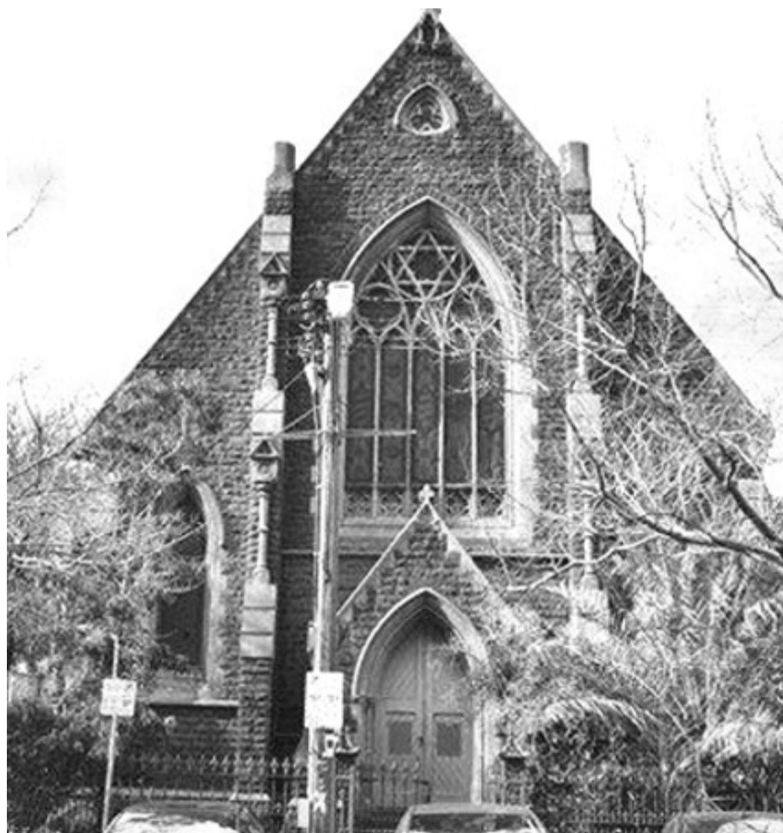
Napier Street-i templom, ahol minden vasárnap délután 3 órákor lett megtartva az Istentisztelet. Ige hirdetés után a gyülekezet felment az első emeletre a templomi nagyterembe, ahol összegyűltek társalogni, kávézni, lemezekre táncolni, saakozni és a közösséget építeni.

Telefon: (03) 9439-8300 Email: csutoros@tpg.com.au