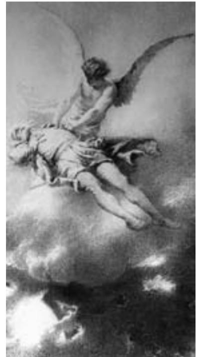
Zichy Mihály 1885-ben készült illusztrációja Az ember tragédiájához — XIII. szín, Ádám az Úrban

1984-ben a Magyar Írók Szövetsége vetette fel, hogy Az ember tragédiája első színrevitele előtti tisztelegként szeptember 21. legyen a magyar dráma ünnepe, hogy a hazai drámairodalom értékeire, azok jobb megismertetésére hívják fel a figyelmet, s ösztönzést adjanak újabb színművek létrehozására.