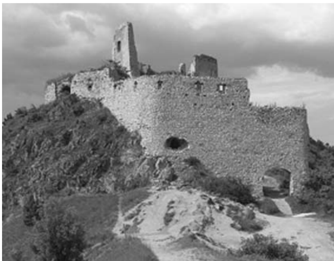
A csejtei vár romjai a mai Szlovákiában

Akárhogy is történt, négy évszázaddal a halála után ki kell mondani, hogy a valódi Báthory Erzsébet minden bizonnyal ártatlan volt — vagy legalábbis semmivel sem bűnösebb, mint bármelyik korabeli főúr. Ettől függetlenül a legendák csejtei rémje még boldogan élhet tovább a rémmesék és mítoszok világában, csak nem szabad elfelejteni, hogy a történeteknek feltehetően vajmi kevés valóságalapja van.