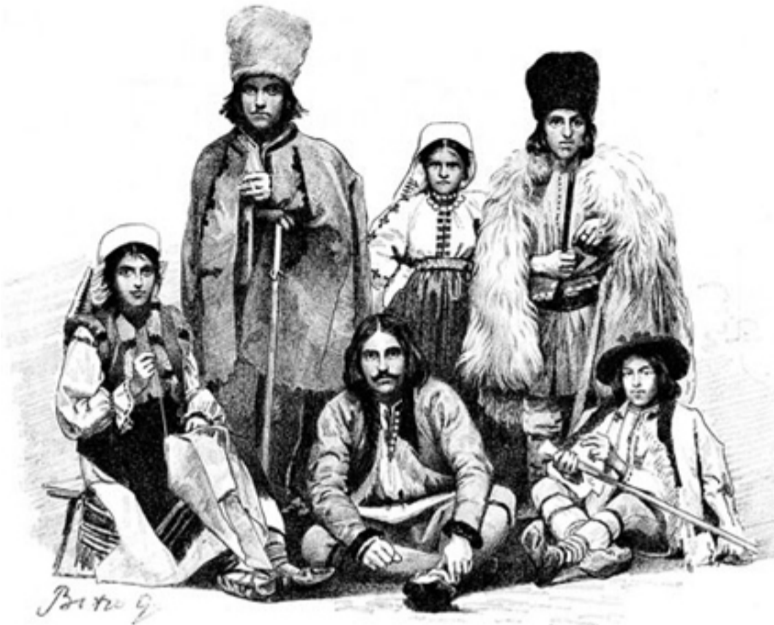
„Hunyad megyei oláhok a Zsil völgyéből” egy régi ábrázoláson

likus rác néven is emlegetett. Hasonlóan kalandos a tót kifejezés