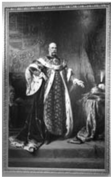
Benczúr Gyula I. Ferenc Józsefet ábrázoló festménye