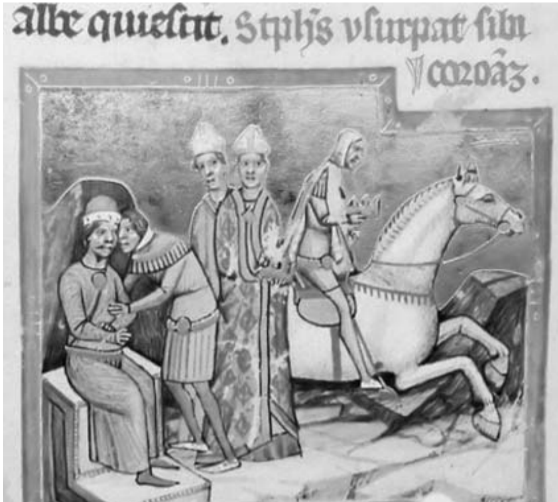
II. László a Képes Krónika miniatúráján. Bizánci segítséggel került trónra, de csak fél évig uralkodott

hűségüket tett volna, valószínűleg ez okozta a vesztét is. Jelentős belső bázzissal rendelkezve népszerű lehetett, mert Pozsonyba menekült unokaöccsét nem támogatta meg, nem érezte hatalmát veszélyeztetve általa. 1162. július közepén koronázták meg, szokatlan módon.