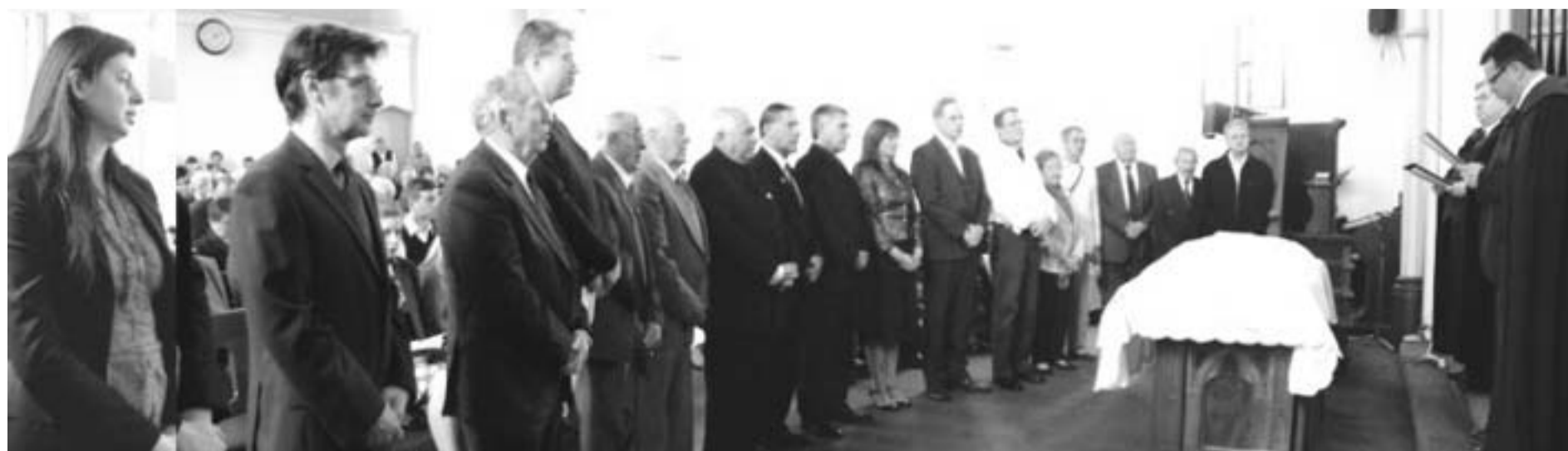
A Presbíteri eskü