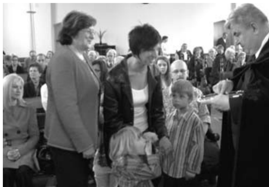
Három generáció a Gyenes családból Úrvacsora osztásnál