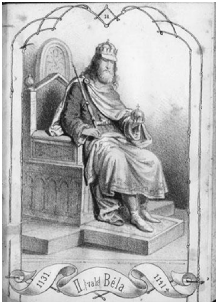
Béla király tíz évig uralkodott vakon is kiválóan