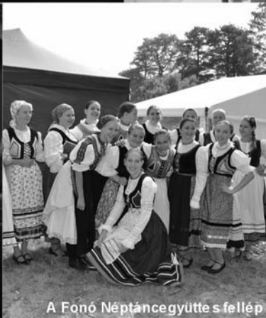
A Fonó Néptáncegyüttes fellép a Harmony Day fesztiválon