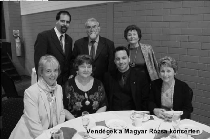
Vendégek a Magyar Rózsa koncerten