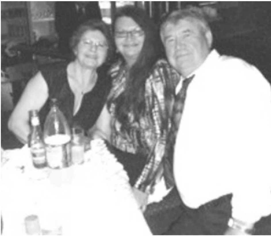
A vidám Basa család