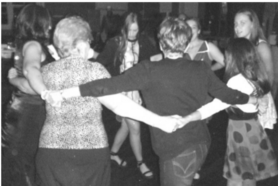
Perdül a tánc...