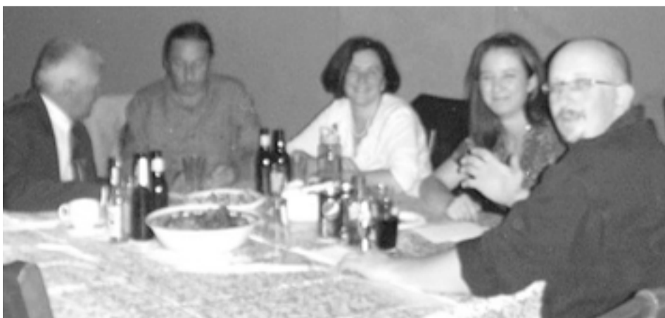
Vacsora után elbeszélgetnek a vendégek