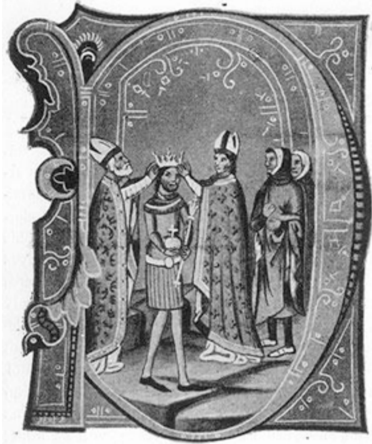
II. István koronázása

maradt. A fegyverszünet lejártá után, 1124-ben Zára kivételével minden korábban magyar uralom alatt álló területet visszafoglalt, júliusban megerősítette Trau és Spalató Kálmán királytól kapott kiváltságait is. 1125 májusában fordult a hadiszerecsé, a Szentföldről visszatérő velencei hajóhad sorban visszahódította a dalmát városokat, melyek csak II. Béla uralkodása idején kerültek ismét magyar fennhatóság alá.