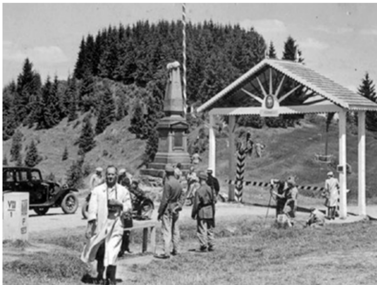
Ukrajna, Vereckei-hágó, a Millennium idején felállított emlékbobiszk (1950-ben elbontották) és a győzelmi kapu

A szovjet idők alatt a magyarság önszerveződése elé a csehszlovák uralom alattinál is erősebb akadályokat gördített a hatalom, az anyaországgal való kapcsolattartás is jóval nehezebbé vált. Ennek eredményeként a hatalmas birodalom határvidékén élő magyarság létszáma és aránya erős csökkenésnek indult. A 2001. évi népszámlálás szerint mindössze 12% volt a magyarság aránya Kárpátján, szemben az 1941. évi 30%-kal. Kárpátja 1991 óta a független Ukrajnához tartozik.