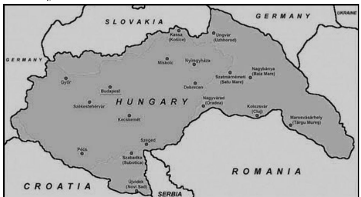
Magyar nemzetállam az etnikai alapú revízió után

Tel: 03 9801-8887 e-mail: koronatours1@gmail.com