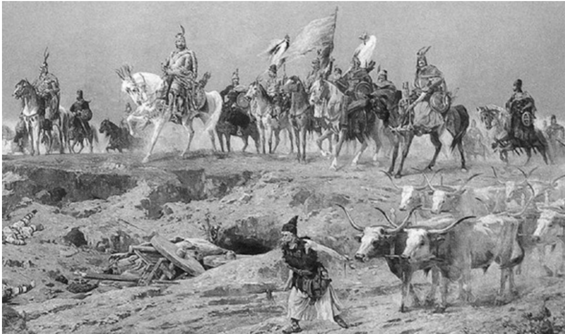
Honfoglalás - a Feszty-körkép részlete

Kárpátján él a Kárpát-medencei magyarság talán leginkább hányatott sorsú része. A XX. század során ötször változott a terület hovatartozása, egy dolog azonban ugyanaz maradt: bármelyik országhoz is tartozott a természeti szépségben gazdag vidék, mindig az adott ország periferiáján helyezkedett el. Sem a két világháború közötti Csehszlovákia, sem a Szovjetunió, sem pedig Ukrajna nem tartotta kiemelten fontosnak a térség fejlesztését.