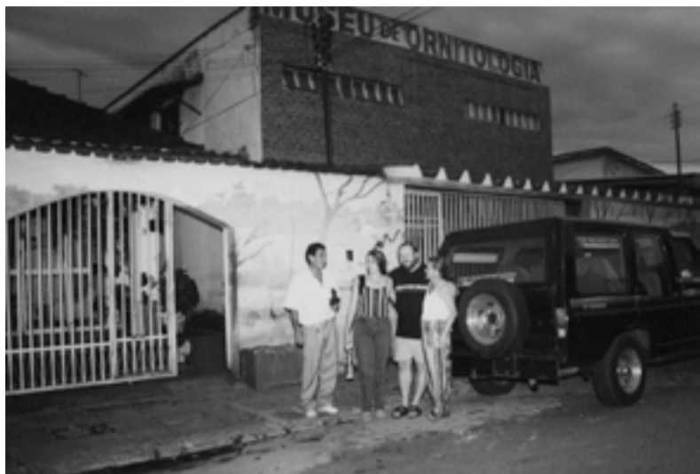
A goianai Madártani Múzeum