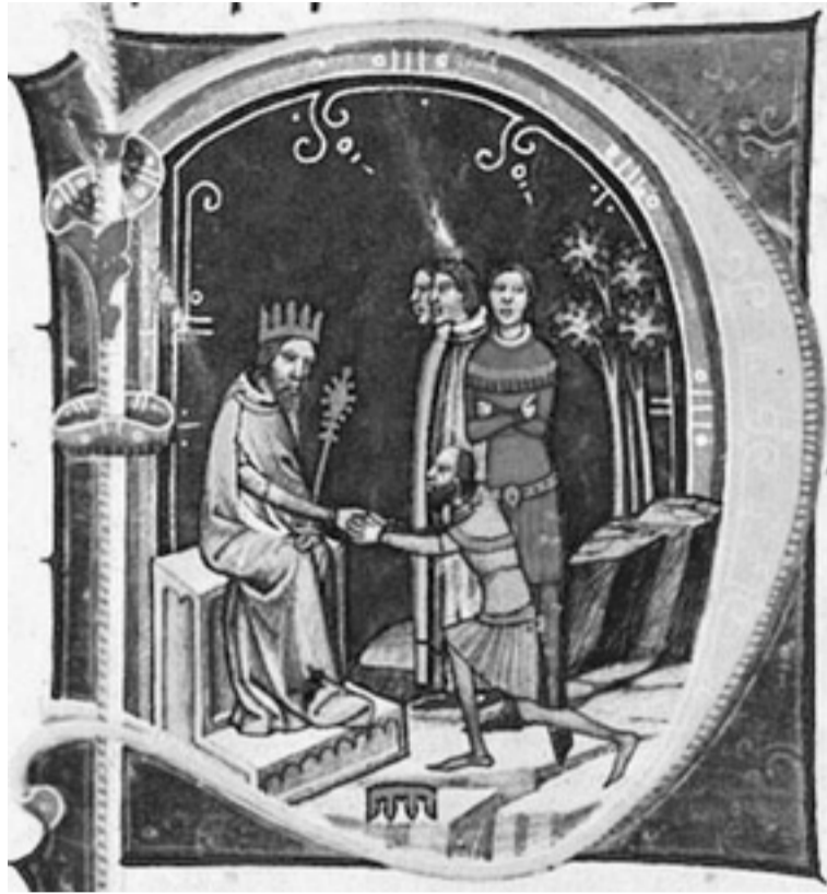
Salamon király segítséget kér IV. Henrik császártól

I. Béla király halála után belviszály tört ki a magyar trónért a Vazul-unokák között. A gyerek Salamon német katonai segítséggel lett király, aki rászorult unokafivérei támogatására, de csak idő kérdése volt, mikor végez velük. A leszámolás előtt azonban együttes erővel védték az országot, és ebből az időből származik például az egyik legismertebb Szent László-legendánk is.