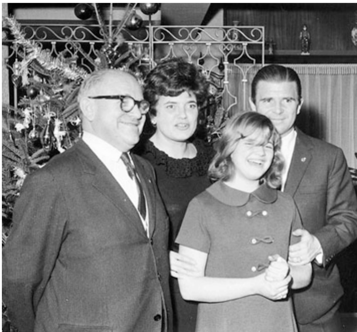
Karácsony Madridban: a Puskás család és Sztanek István, a kispesti hentes

után hét éve férje nélkül ünnepli a Megváltó születését Puskás Ferencné. A világ egyik legjobb labdarúgójának, a világ talán legismertebb magyarjának a felesége fáradhatatlanul ápolja férje emlékét. Erzsébet asszony a lapunknak adott interjúban elmondta, Puskáséknál a futball olykor a karácsonynál is fontosabb volt.