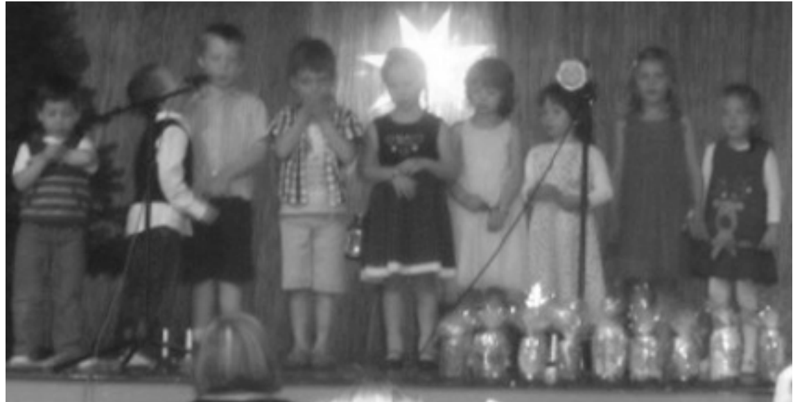
A legfiatalabbak csoportja