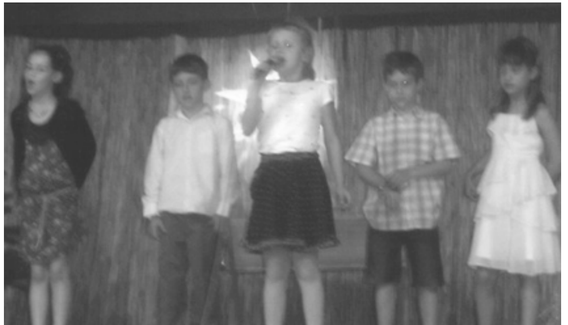
A középső osztályosok