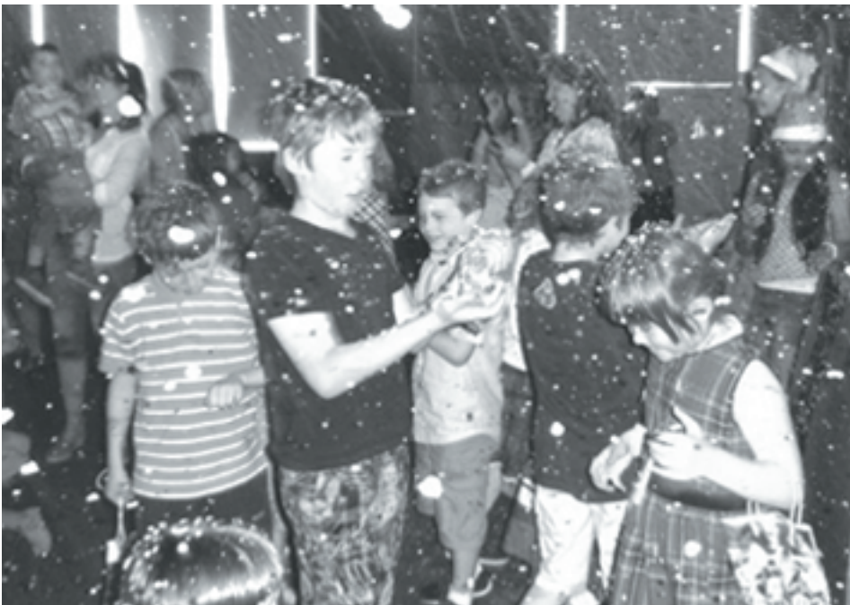
Magindult a hóvihar