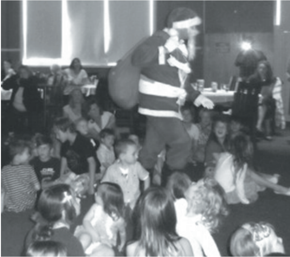
Megérkezett a Mikulás