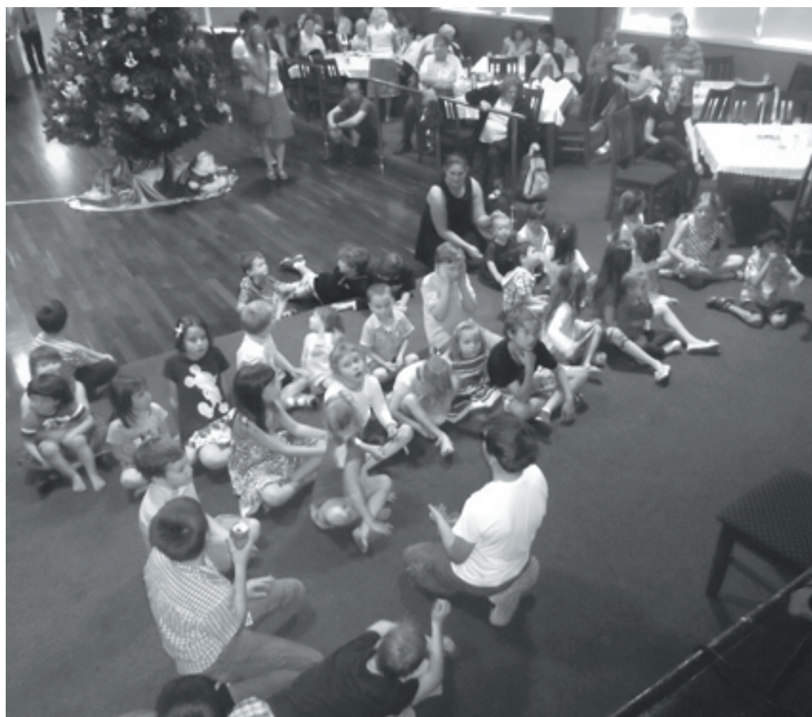
A Vasárnapi Iskolások várják a Mikulást a Bocskai Nagyteremben