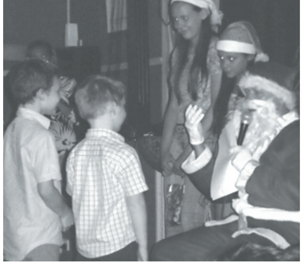
A Mikulás biztatja a gyerekeket: beszéljenek magyarul és jól viselkedjenek.