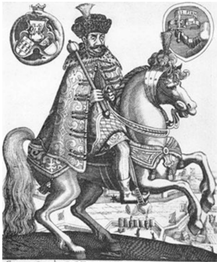
Bethlen Gábor lovas ábrázolása korabeli metszeten

gyar urak és a szászok is hasonló panaszkokkal árasztották el a Portát, Nazuph nagyvezír Bethlen Gábort Erdély fejedelmévé nevezte ki, és „Szkander bégnek, Magyar Ogli Ali basának, bucsáki, silistriai tatároknak, moldovai s havasalföldi vajdáknak erős parancsokat adatek, hogy mihelyt