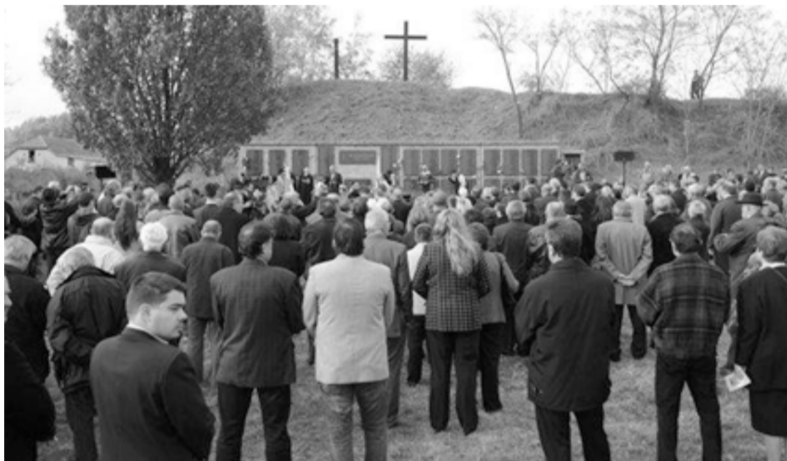
Emlékezők az 1944-45-ös vérengzések ártatlan áldozatainak emlékműve előtt a szabadkai Zentai úti temetőben 2013. november 2-án

„Ha két hét nem elég arra, hogy a rendőrség egy ilyen ügyben hatékonyan eljárva eredményt tudjon produkálni, ha két hét nem elég ahhoz, hogy a szerb kormány világos mondatokat fogalmazzon meg az eset elítélésével