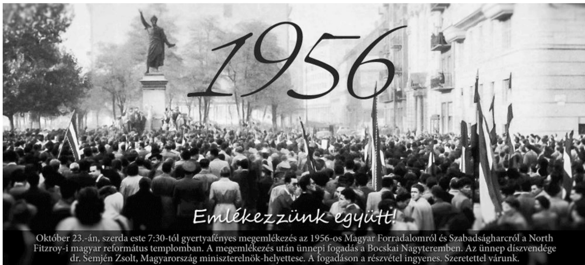
Október 23.-án, szerda este 7:30-tól gyertyafényes megemlékezés az 1956-os Magyar Forradalomról és Szabadságharcról a North Fitzroy-i magyar református templomban. A megemlékezés után ünnepi fogadás a Bocskai Nagyteremben. Az ünnep díszvendége dr. Semjén Zsolt, Magyarország miniszterelnök-helyettese. A fogadáson a részvétel ingyenes. Szeretettel várunk.