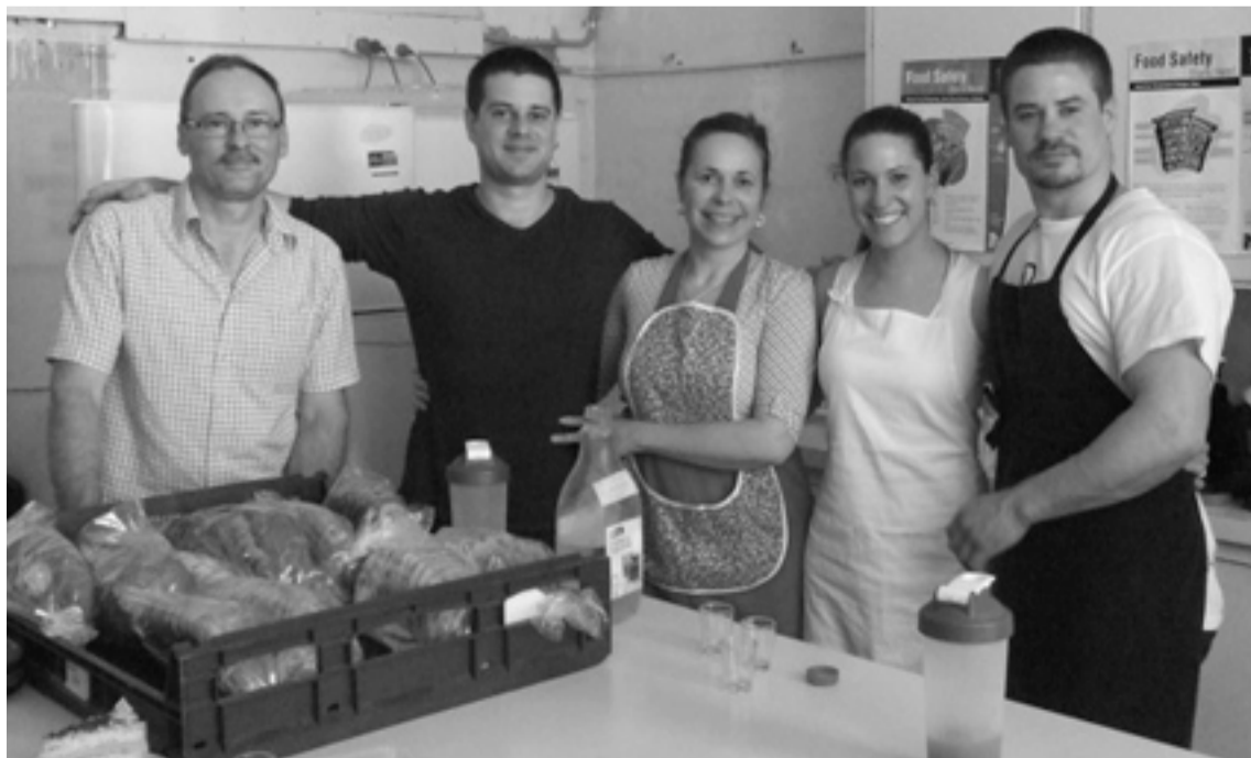
A Zsákai család

November 24-én vasárnap de. 12 órától tartjuk az éves vásárunkat.