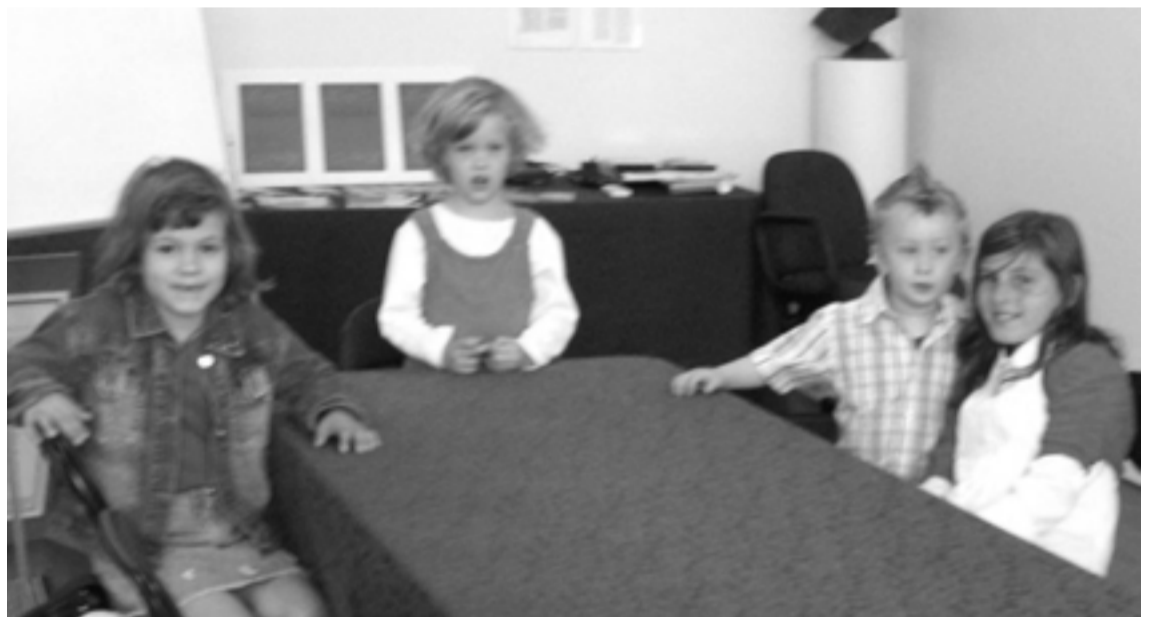
Minden hónap első vasárnapján 11.15 órától vasárnapi iskolai oktatás. Képünkön az oktatásra váró gyerekek.

Szabad-e adót fizetni a császárnak, vagy nem (Mark 12, 12, 14) Adót általában nem szívesen fizetnek az emberek. Igénkben is erről van szó, mert nemzeti és teológiai szempontból képtelenségnek érzik, hogy Isten népe pogány felsőségnek fizessen adót. Ezt használják ki a nép vezetői Jézus provokálására. Ha azt mondja ugyanis, hogy fizessenek, ez a császár fennhatóságának elismerését jelentené, ha azt mondja, nem kell fizetni, az ellenállást sugallna. Ezért leleplezve a kérdezők ravasz szándékát, Jézus egy pénzt vesz a kezébe, melynek egyik oldalán a császár képe látható, ezért az jár neki, míg egész életünkkel az Istennek tartozunk. A baj ott kezdődik, ha a császár nagyobb hangsúlyt kap, vagy ha Istentől elfelejtkezünk.