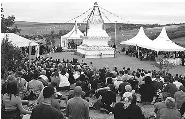
A nógrádi Becskén felállított sztúpa a buddhista gyakorlás célját, a megvilágosodást fejezi ki

Buddhista vallási építményt, úgynevezett sztúpát avattak a Nógrád megyei Becskén. Az eseményre Európa több országából érkeztek buddhisták és a vallást nem gyakorlók egyaránt. A sztúpát Serab Gyalcen rinpoce nepáli buddhista mester avatta fel.