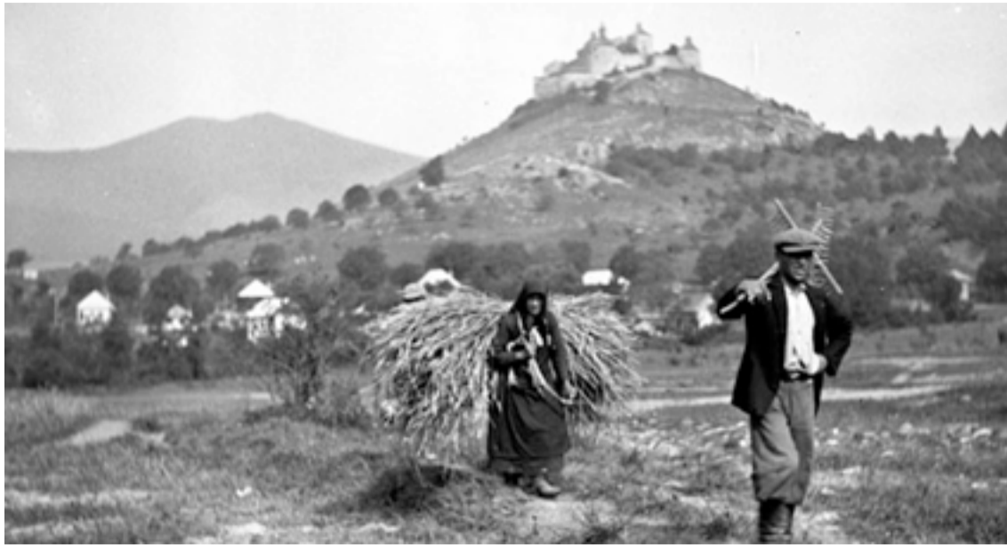
Krasznahorka büszke vára

évek elején települt ki Amerikába, és aki több montanai rezervátumban is megfordult — rendszeresen tudósított leveleiben az indiánokról. (Szürke Bagoly remek könyvét, a Két kicsi hódót is ő küldte haza az öccsének, fordításra ajánlva.) Baktay negyven körül járt, amikor három unokatestvérével és két unokahúgával — a nővére lányával — indián törzset alapított a Duna-kanyarban, a család zebegényi nyaralójában. Az első Duna-parti indián táborozás idején az egyik unokahúg tizennyolc éves volt, Amrita Shergilnek hívták, és tíz év volt még hátra sűrű életéből. A neve örökléte jelent, és bár földi léte, ha az évek számában mérjük, rövid lett, mégis az indiánoknak nevet adó ország egyik legnagyobb festőjeként távozott az Örök vadászmezőkre. Hogy apám honnan tudta, hogy Baktayék nyaranta indiánozni szoktak a Duna-parton? Talán épp Fe-