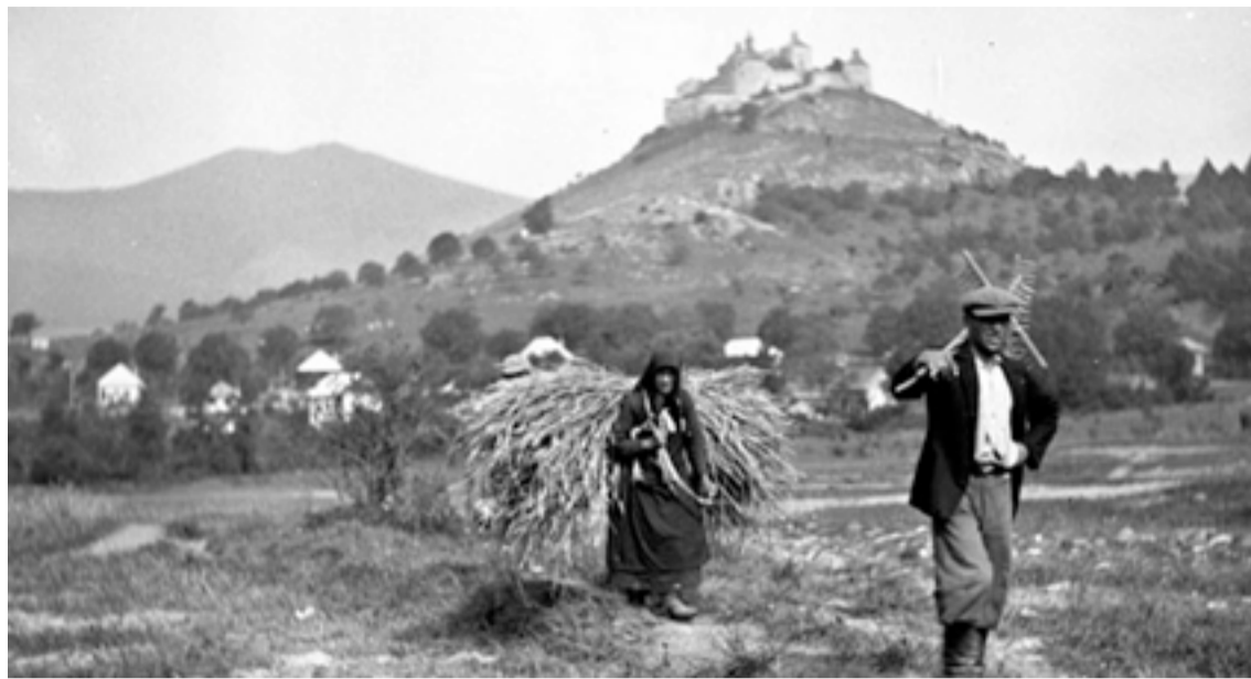
Krasznahorka büszke vára