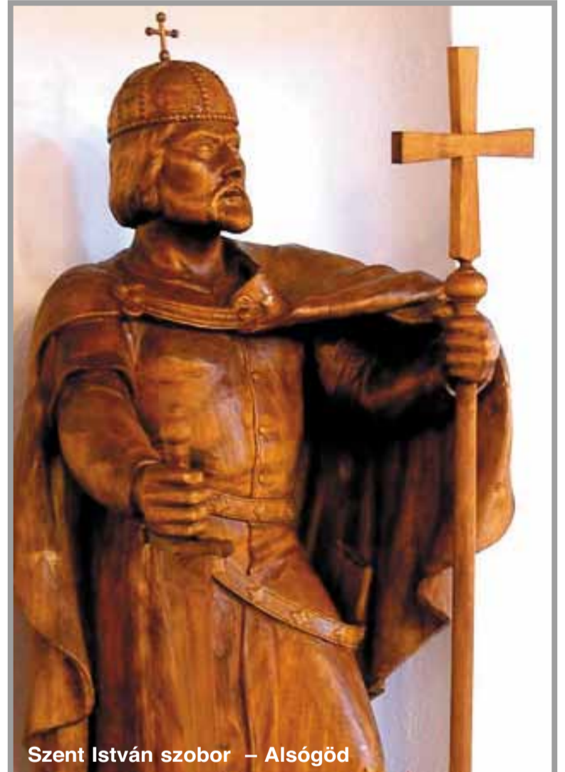
Szent István szobor – Alsógöd

Követve a magyar történetet, 1825-ben újra összehívták a rendi országgyűlést, amivel a magyar nemesség ismét jelen volt az állam életében.