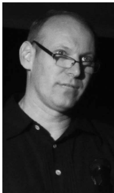
és a Kaláris Táncsoport .